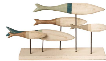
Cod: DL 2003 Des: Gruppo pesci verticale Note: 28x9x30