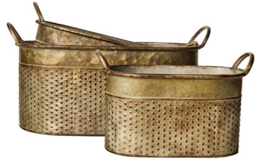
Cod: DM 5023 Des: Ceste rettangolari forellini S/3 Note: 40x25.5x20, 33.5x21.5x17, 27.5x18x14