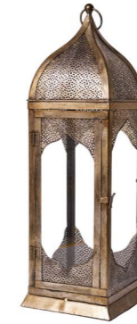
Cod: L 1327 Des: Lanterne Marrakesh grande Note: 21x21x68