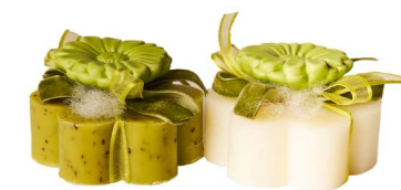
Cod: 7620/Ve Des: Sapone decorato fiore verde Note: 8x8x5