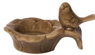
Cod: CK 962/Bg Des: Ciotolina porta tee-light uccellino beige Note: 11x8x6