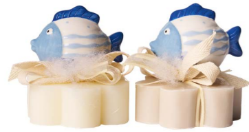
Cod: 7660 Des: Sapone decorato pesciolino d'oro Note: 8x8x9