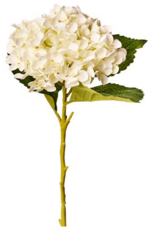
Cod: FB 155/Bi Des: Ortensia bianca Note: 50cm