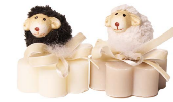
Cod: 7609 Des: Sapone decorato pecorella lana Note: 8x8x8,5