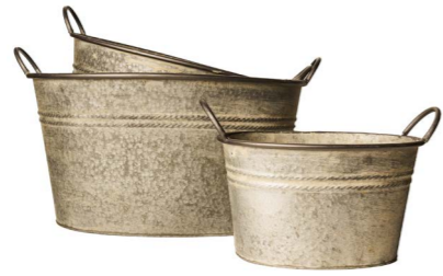
Cod: DM 5021 Des: Cesti maxi ovali con manici S/3 Note: 54x41x28.5, 43x33x23.5, 32.5x25.5x18.5