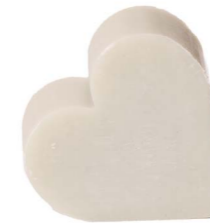
Cod: 4601/Veq Des: Sapone cuore grande verde acquamarina Note: 6,8x6,5x3