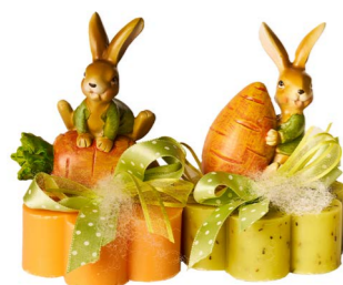
Cod: 7626/Ar Des: Sapone coniglio carota arancione Note: 8x8x8,5