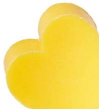
Cod: 4601/Gi Des: Sapone cuore grande verde giallo Note: 6,8x6,5x3