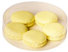
Cod: D 0451/GI Des: Macarons gialli 5pz Note: 37mm