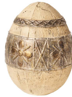
Cod: RS 1013 Des: Uovo in resina grande Note: 15x15x20