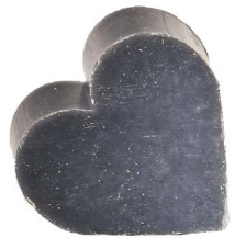
Cod: 4601/BL Des: Sapone cuore grande verde acquamarina Note: 6,8x6,5x3