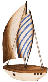
Cod: DL 2006 Des: Barca Zanzibar vela piccola Note: 13x6x24