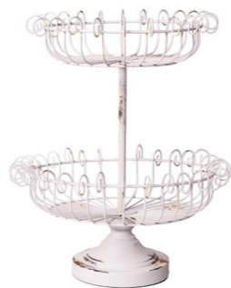
Cod: DM 5007 Des: Espositore a cesto 2 piani Note: 38x38x43