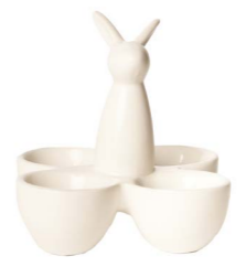
Cod: CK 680 Des: Portauovo quadrato coniglietto Note: 12x12x12