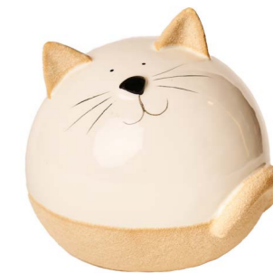
Cod: CK 952 Des: Gatto grande Note: 13x13x13