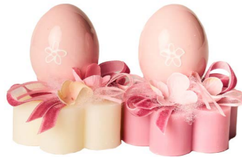
Cod: 7602/Ro Des: Sapone uovo in ceramica rosa Note: 8x8x9