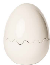
Cod: CK 865 Des: Scatola uovo maxi Note: 18x18x25