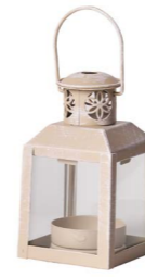
Cod: L 1201 Des: Lanterna mini in metallo beige Note: 4,5x4,5x8