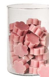
Cod: 4502/Roa Des: Sapone fiore medio (pz50) rosa antico Note: 4x4x1,7