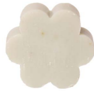
Cod: 4501/Veq Des: Sapone fiore grande tiffany Note: 8x8x3