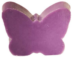
Cod: 4901/Vi Des: Sapone farfalla grande viola Note: 8x5,5x3