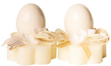
Cod: 7602/Bi Des: Sapone uovo in ceramica bianco Note: 8x8x9