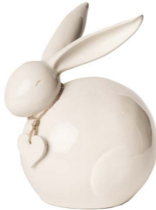
Cod: CK 841 Des: Coniglietto grande con cuore Note: 15x11x19