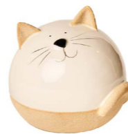
Cod: CK 950 Des: Gatto piccolo Note: 9x9x9