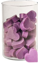
Cod: 4602/Vi Des: Sapone cuore medio (pz42) viola Note: 4,5x4,2x1,7