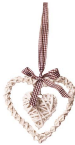
Cod: R 0147/Bi Des: Cuore con cuore appeso piccolo bianco Note: 15x15