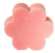
Cod: 4501/Ro Des: Sapone fiore grande rosa Note: 8x8x3