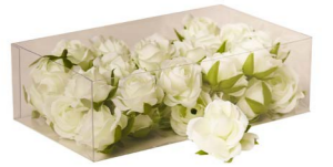
Cod: D 0602/BI Des: Roselline bianche S/36 Note: 3x3