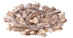
Cod: DL 5008 Des: Piatto legno betulla piccolo 35cm Note: 35x35x8