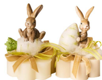
Cod: 7626/Bi Des: Sapone coniglio carota bianca Note: 8x8x8,5