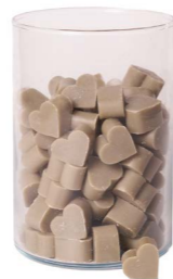
Cod: 4603/Gr Des: Sapone cuore piccolo (pz120) grigio Note: 3x2,5x1,7