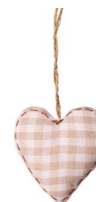
Cod: DT 505 Des: Cuore tessuto a quadri 8cm Note: 8x8