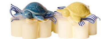
Cod: 7668 Des: Sapone decorato tartaruga Note: 8x8x6