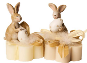
Cod: 7625 Des: Sapone coniglio con uovo pois Note: 8x8x8,5