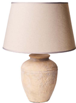
Cod: LC 103 Des: Lampada terracotta/paralume crema Note: 10x53