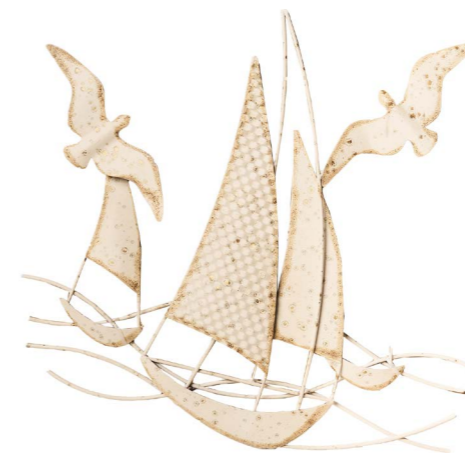
Cod: DM 2017 Des: Quadro vele e gabbiani in volo Note: 45x43