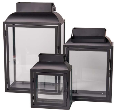
Cod: L 1342 Des: Set lanterne in metallo nero rettangolari S/3 Note: Altezze 25x35x49