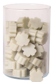
Cod: 4303/Veq Des: Sapone quadrifoglio piccolo (pz65) acquamarina Note: 3,5x3,5x1,7