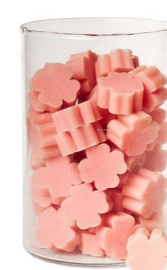
Cod: 4303/Ro Des: Sapone quadrifoglio piccolo (pz65) rosa Note: 3,5x3,5x1,7