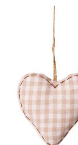
Cod: DT 504 Des: Cuore tessuto a quadri 11cm Note: 11x11