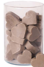
Cod: 4602/Gr Des: Sapone cuore medio (pz42) grigio Note: 4,5x4,2x1,7