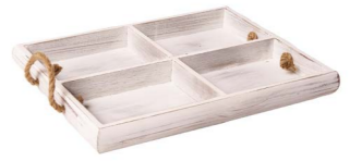
Cod: DL 5003 Des: Vassoio legno con scomparti Note: 37x30x4