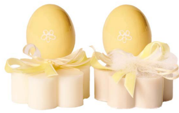
Cod: 7602/Gi Des: Sapone uovo in ceramica giallo Note: 8x8x9