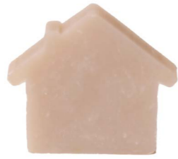
Cod: 4654/To Des: Sapone casetta grande tortora Note: 8x7x1,7