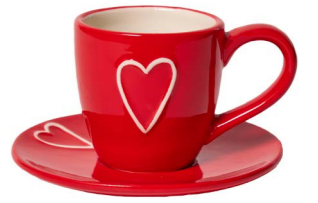
Cod: CK 050/Rs Des: Tazza da caffè con cuore rossa Note: piattino 12x12; tazzina 10x6x7