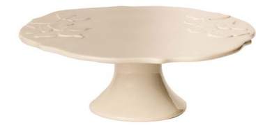
Cod: CK 955 Des: Alzata farfalle 28cm Note: 28x28x10