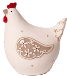
Cod: CK 932 Des: Gallina con ala pizzo bianca grande Note: 15x11x17