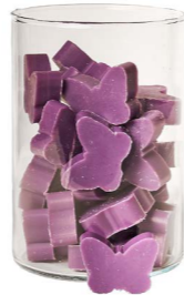
Cod: 4902/Vi Des: Sapone farfalla medio (pz36) viola Note: 4,5x4x1,7