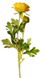
Cod: FB 992/Gi Des: Ramo 40cm ranuncoli giallo Note: 40cm