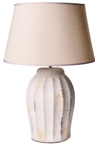
Cod: LC 101 Des: Lampada media bianca/paralume crema Note: 18x59