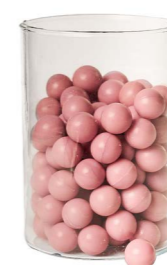
Cod: 4010/Roa Des: Sapone perle (pz125) rosa antico Note: 2,5x2,5