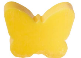
Cod: 4904/Gi Des: Sapone farfalla sottile giallo Note: 8x5,5x1,7