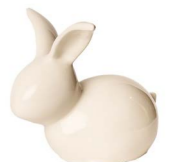
Cod: CK 857 Des: Coniglietto grande Note: 21x12x20