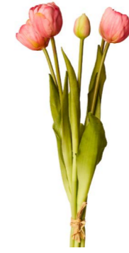
Cod: FB 165/Ro Des: Tulipani rosa grandi Note: altezza 40cm