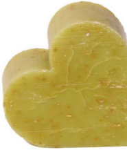
Cod: 4601/Ve Des: Sapone cuore grande verde Note: 6,8x6,5x3