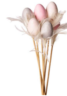
Cod: D 0651/Ro Des: Ovetto grandi 4cm rosa Note: 4x4