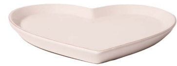
Cod: CK 056/Bi Des: Piatto a forma di cuore bianco Note: 20x21x2