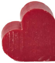
Cod: 4601/RS Des: Sapone cuore grande rosso Note: 6,8x6,5x3