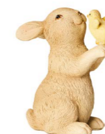
Cod: RS 1026 Des: Coniglietto mini con pulcino Note: 6x4x8