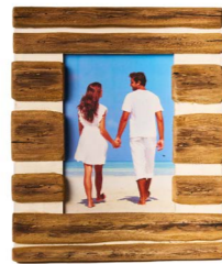
Cod: DL 3021 Des: Cornice in legno grande Note: 22x26