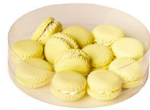
Cod: D 0450/GI Des: Mini macarons gialli 12pz Note: 22mm