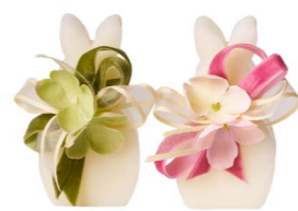
Cod: 7460/Baby Des: Sapone coniglietto decorato baby Note: 4x3x7