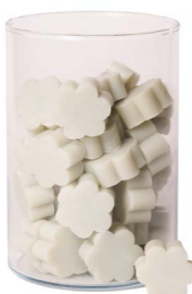
Cod: 4502/Veq Des: Sapone fiore medio (pz50) acquamarina Note: 4x4x1,7