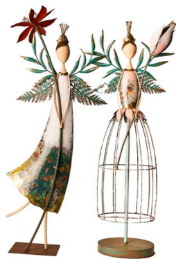
Cod: DM 2023 Des: Fatina con fiore luci Note: 30x10x70