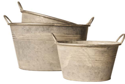
Cod: DM 5022 Des: Cesti maxi ovali manici vintage S/3 Note: 54.5X42X29, 44X35.5X24.5, 35X28X19.5