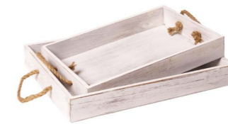
Cod: DL 5002 Des: Set vassoi in legno manici corda 2PZ Note: piccolo 34x24x6; grande 40x29x6