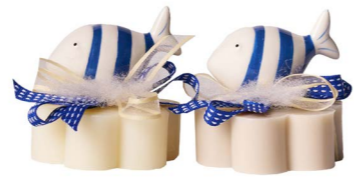
Cod: 7659 Des: Sapone decorato pesciolino righe blu Note: 8x8x9