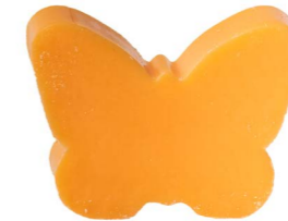
Cod: 4904/Ar Des: Sapone farfalla sottile arancione Note: 8x5,5x1,7