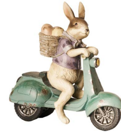
Cod: RS 1016 Des: Coniglietto su vespa Note: 18x8x18