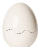
Cod: CK 863 Des: Scatola Uovo medio Note: 11x11x15