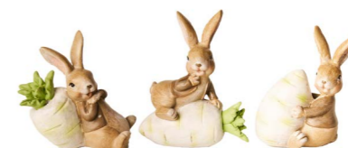
Cod: D 0460/Bi Des: Coniglietti con carota bianca S/4 Note: 6,5x4x7