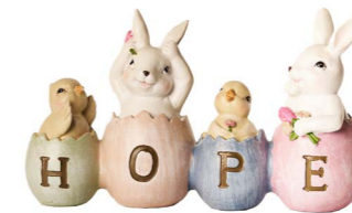
Cod: RS 1018 Des: Coniglietti scritta HOPE Note: 19x4x12