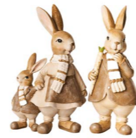
Cod: RS 1020 Des: Coppia coniglietti con sciarpa Note: 14x7x23