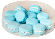
Cod: D 0450/AZ Des: Mini macarons azzurro 12pz Note: 22mm