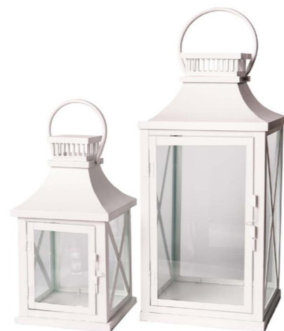
Cod: L 1341 Des: Lanterne in metallo nero con vetro X S/2 Note: 13x35, 18x42, 25x90