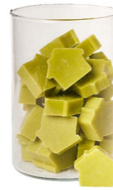
Cod: 4652/Vem Des: Sapone casetta media (42pz) mughetto Note: 5x4x1,7