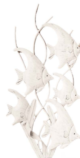
Cod: DM 2015 Des: Quadro pesci verticale Note: 40x90