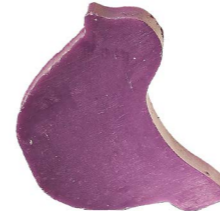
Cod: 4754/Vi Des: Sapone uccellino sottile rosa Note: 8x6,5x1,7