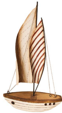
Cod: DL 2007 Des: Barca Zanzibar vela grande Note: 22x10x40