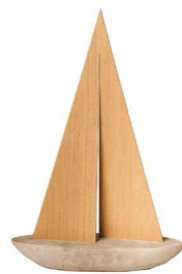
Cod: DL 2000 Des: Barca piccola con vele legno Note: 32x10x50