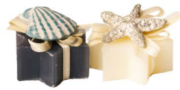
Cod: 7448 Des: Sapone mignon misto mare Note: 4x4x3