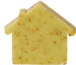
Cod: 4654/ve Des: Sapone casetta sottile verde Note: 8x7x1,7