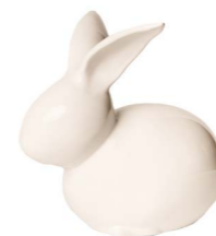
Cod: CK 858 Des: Coniglietto maxi Note: 26x16x25