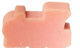
Cod: 4201/Ro Des: Sapone trenino grande rosa Note: 6x4x3