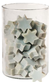
Cod: 4802/Az Des: Sapone stella media (pz60) azzurro Note: 4,4x3,8x1,7