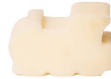
Cod: 4201/Bi Des: Sapone trenino grande bianco Note: 6x4x3