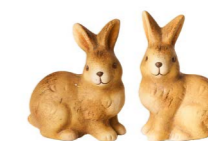
Cod: D 0274 Des: Coniglietti mini seduti Note: 6x4x6