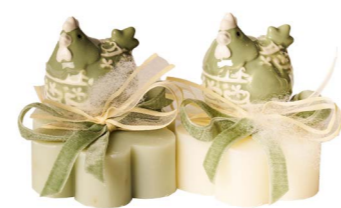
Cod: 7610/Ves Des: Sapone gallinella verde salvia Note: 8x8x8,5