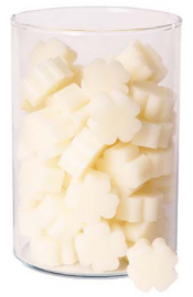
Cod: 4303/Bi Des: Sapone quadrifoglio piccolo (pz65) bianco Note: 3,5x3,5x1,7