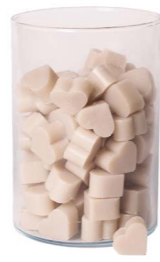
Cod: 4603/To Des: Sapone cuore piccolo (pz120) tortora Note: 3x2,5x1,7