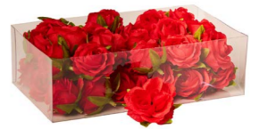
Cod: D 0602/RS Des: Roselline rosse S/36 Note: 3x3