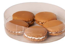
Cod: D 0451/Bg Des: Macarons marroni 5pz Note: 37mm