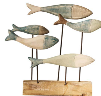
Cod: DL 2002 Des: Gruppo pesci orizzontale Note: 26x8x17