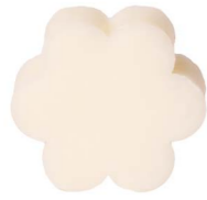
Cod: 4501/Bi Des: Sapone fiore grande bianco Note: 8x8x3