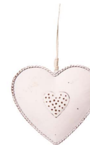
Cod: D 2046 Des: Cuore grande con cuoricino pois Note: 10x10