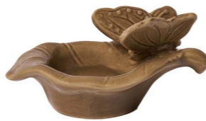
Cod: CK 963/Bg Des: Ciotolina porta tee-light farfalla beige Note: 11x7,5x6