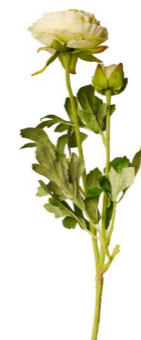
Cod: FB 992/Bi Des: Ramo 40cm ranuncoli bianco Note: 40cm