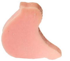
Cod: 4754/Ro Des: Sapone uccellino sottile rosa Note: 8x6,5x1,7