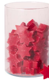
Cod: 4802/RS Des: Sapone stella media (pz60) rosso Note: 4,4x3,8x1,7