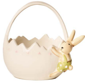
Cod: CK 683 Des: Cestino in ceramica coniglietto Note: 13x13x13