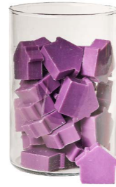
Cod: 4652/Vi Des: Sapone casetta media (42pz) Viola Note: 5x4x1,7