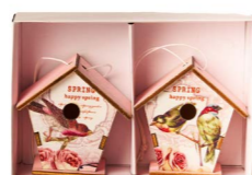
Cod: D 2500/Ro Des: Mini casetta per uccellini rosa 2PZ Note: 4x2x6