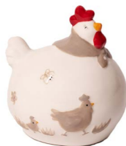
Cod: CK 933 Des: Gallina tonda piccola Note: 9,5x8x11