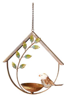
Cod: DM 2024 Des: Casetta per uccellini Note: 28x8x35