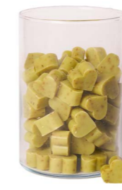
Cod: 4603/Ve Des: Sapone cuore piccolo (pz120) verde Note: 4x4x1,7