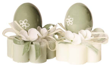
Cod: 7602/Ves Des: Sapone uovo in ceramica salvia Note: 8x8x9