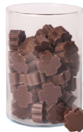
Cod: 4303/Mr Des: Sapone quadrifoglio piccolo (pz65) marrone Note: 3,5x3,5x1,7