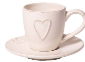
Cod: CK 050/Bi Des: Tazza da caffè con cuore bianca Note: piattino 12x12; tazzina 10x6x7