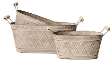
Cod: DM 5044 Des: Ceste ovali manici rombo S/3 Note: 32x18x14, 26.5x16x13, 22x13x11