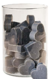
Cod: 4602/BL Des: Sapone cuore medio (pz42) blu Note: 4,5x4,2x1,7