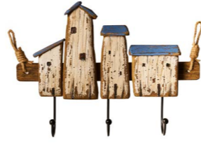
Cod: DL 3002 Des: Attaccapanni casette bianche Note: 40x30