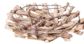
Cod: DL 5009 Des: Piatto legno betulla grande 45cm Note: 41x41x10