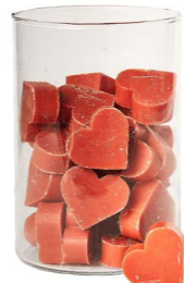
Cod: 4602/Co Des: Sapone cuore medio (pz42) corallo Note: 4,5x4,2x1,7