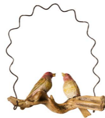
Cod: D 4501/Ro Des: Altalena con uccellini rosa Note: 22x9x28