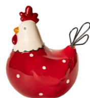
Cod: CK 938 Des: Gallina rossa media con pois Note: 12x10x13