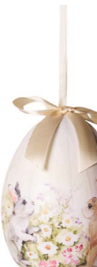
Cod: D 6511 Des: Ovetto con coniglietti Note: altezza 15cm