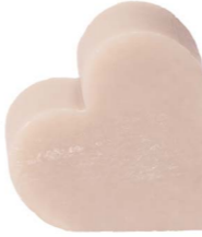
Cod: 4601/To Des: Sapone cuore grande tortora Note: 6,8x6,5x3