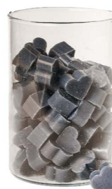
Cod: 4603/BL Des: Sapone cuore medio (pz42) blu Note: 4,5x4,2x1,7