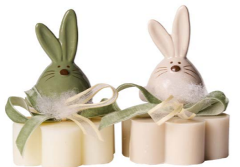
Cod: 7621/Ves Des: Sapone coniglio tondo verde salvia Note: 8x8x11