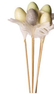
Cod: D 0651/VE Des: Ovetto grandi 4cm verdi Note: 4x4