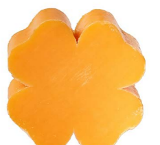
Cod: 4301/Ar Des: Sapone quadrifoglio grande arancio Note: 7,3x7,3x3