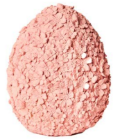
Cod: RS 1011/RO Des: Uovo grande con fiorellini rosa Note: 12x12x16