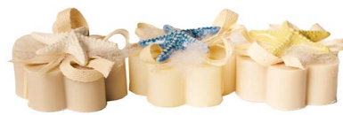
Cod: 7655 Des: Sapone decorato stella marina Note: 8x8x6