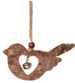
Cod: D 2035 Des: Uccellino in legno piccolo Note: 10x0,5x10