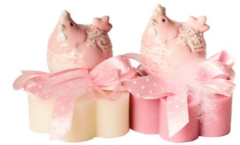
Cod: 7610/Ro Des: Sapone decorato gallinella rosa Note: 8x7x1,7