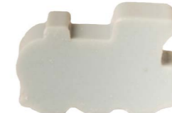
Cod: 4201/Az Des: Sapone trenino grande azzurro Note: 6x4x3