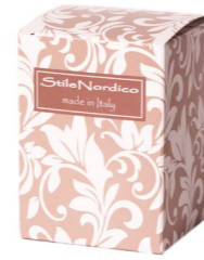
Cod: A 018/BG Des: Scatola con stampa beige Note: 8x8x11