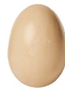
Cod: 4251/To Des: Sapone a uovo tortora Note: 4x4x6