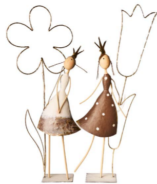
Cod: DM 2022 Des: Angelo Primavera con luci Note: 20x15x74