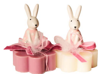
Cod: 7623/Ro Des: Sapone coniglietto salopette rosa Note: 8x8x11