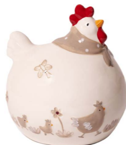
Cod: CK 935 Des: Gallina tonda grande Note: 15x12,5x15