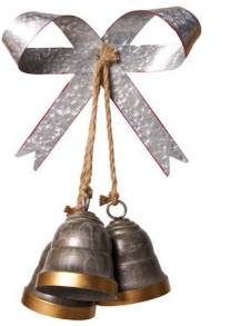
Cod: DM 1108 Des: Gruppo campanelle con fiocco Note: 30x10x50