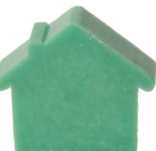
Cod: 4651/VEB Des: Sapone casetta grande verde brillante Note: 8x6,8x3