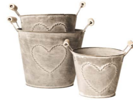
Cod: DM 5050 Des: Ceste rotonde manici cuore S/3 Note: 18x14.5, 15.5x12.5, 13x10.8