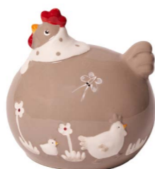
Cod: CK 934 Des: Gallina tonda media Note: 12x10x13