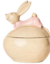
Cod: CK 688 Des: Scatola uovo coniglietta sdraiata Note: 11x8x14