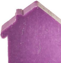
Cod: 4654/Vi Des: Sapone casetta viola sottile Note: 8x7x1,7