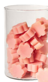
Cod: 4502/Ro Des: Sapone fiore medio (pz50) rosa antico Note: 4x4x1,7