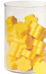
Cod: 4502/Gi Des: Sapone fiore medio (pz50) giallo Note: 4x4x1,7