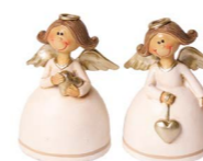
Cod: D 0447 Des: Angioletto con ali argento Note: 5x3x7