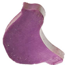
Cod: 4754/Vi Des: Sapone uccellino sottile viola Note: 8x6,5x1,7