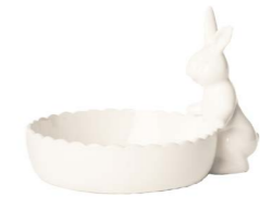
Cod: CK 690 Des: Ciotolina con coniglietto piccolo Note: 14x11x9