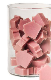
Cod: 4652/Roa Des: Sapone casetta media (42pz) rosa antico Note: 5x4x1,7