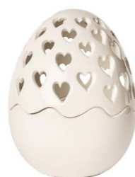
Cod: CK 869 Des: Scatola Uovo intagliata grande Note: 14x14x20