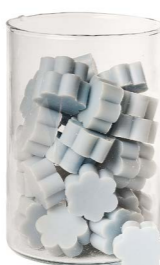
Cod: 4502/Az Des: Sapone fiore medio (pz50) azzurro Note: 4x4x1,7