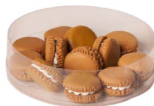
Cod: D 0450/Bg Des: Mini macarons marroni 12pz Note: 22mm