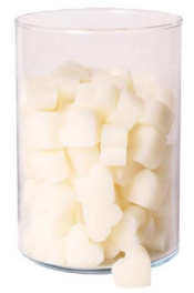
Cod: 4603/Bi Des: Sapone cuore piccolo (pz120) bianco Note: 3x2,5x1,7