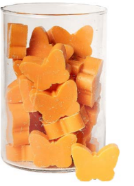
Cod: 4902/Ar Des: Sapone farfalla medio (pz36) arancio Note: 4,5x4x1,7