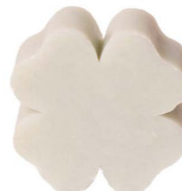
Cod: 4301/Veq Des: Sapone quadrifoglio grande tiffany Note: 7,3x7,3x3