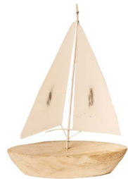
Cod: DM 2010 Des: Barca base legno piccola Note: 18x7x25