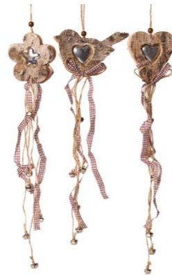
Cod: D 2033 Des: Formine da appendere in legno con sonagli Note: 10x0,5x10