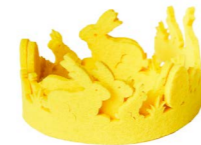
Cod: F199/GI Des: Nastro feltro coniglietti 1m giallo Note: 8x100