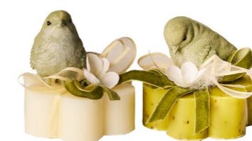
Cod: 7572/Veq Des: Sapone uccellino in resina verde pastello Note: 8x8x8,5