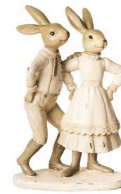
Cod: RS 1014 Des: Coppia coniglietti Note: 14x9x22