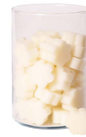
Cod: 4502/Bi Des: Sapone fiore medio (pz50) bianco Note: 4x4x1,7