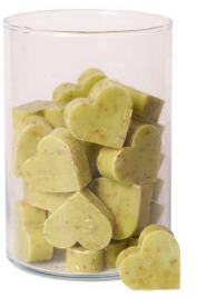
Cod: 4602/Ve Des: Sapone cuore medio (pz42) verde Note: 4,5x4,2x1,7