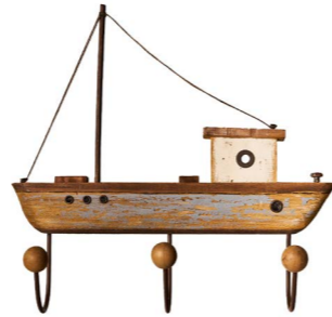
Cod: DL 3001 Des: Attaccapanni barca a vela Note: 38x29