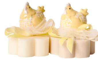
Cod: 7610/Gi Des: Sapone decorato gallinella giallo Note: 8x7x1,7