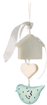
Cod: 7950/Az Des: Gruppo sapone uccellino metallo azzurro Note: 20cm