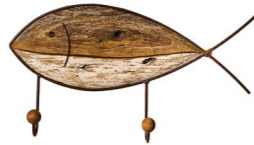
Cod: DL 3003 Des: Attaccapanni pesce singolo Note: 43x22