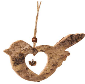
Cod: D 2031 Des: Uccellino in legno grande Note: 10x0,5x10