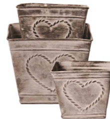
Cod: DM 5041 Des: Ceste con cuore senza manici Note: 10x10x9, 13x13x11, 15x15x13