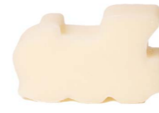
Cod: 4204/Bi Des: Sapone trenino sottile bianco Note: 6x5x1,7