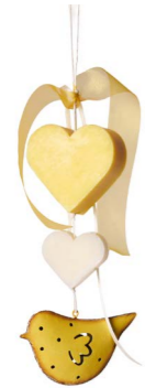
Cod: 7950/Gi Des: Gruppo sapone uccellino metallo giallo Note: 20cm