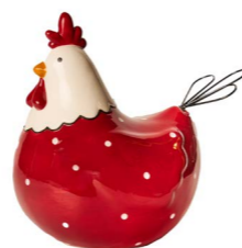
Cod: CK 939 Des: Gallina rossa grande con pois Note: 18x13x18