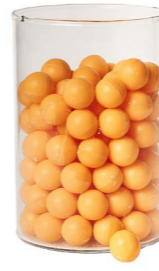
Cod: 4010/Ar Des: Sapone perle (pz125) arancione Note: 2,5x2,5