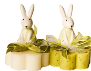
Cod: 7623/Ve Des: Sapone coniglietto salopette verde Note: 8x8x11