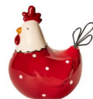
Cod: CK 937 Des: Gallina rossa mini con pois Note: 9x7x10