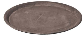
Cod: DM 5017 Des: Vassoio metallo medio Note: 43x43