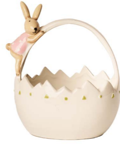
Cod: CK 684 Des: Cestino in ceramica coniglietta Note: 15x15x17