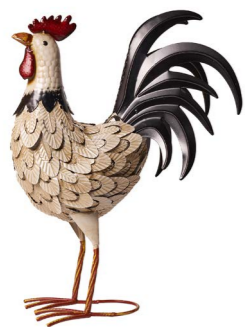
Cod: DM 2036 Des: Gallo colorato medio Note: 33x15x48