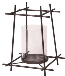
Cod: DM 1066 Des: Portacandela bastoni incrociati grande Note: 25x25x30