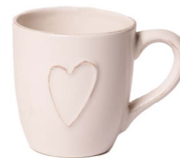
Cod: CK 047/Bi Des: Mug quadrata con cuore bianca Note: 11x8x9