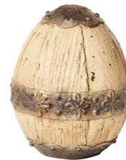
Cod: RS 1012 Des: Uovo in resina piccolo Note: 11x11x15