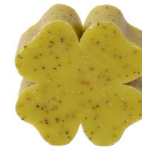
Cod: 4301/Ve Des: Sapone quadrifoglio grande verde Note: 7,3x7,3x3