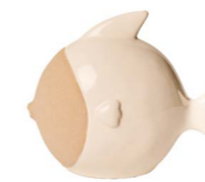
Cod: CK 851 Des: Pesce palla medio Note: 18x9x16