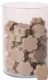
Cod: 4502/Gr Des: Sapone fiore medio (pz50) grigio Note: 4x4x1,7