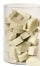
Cod: 4102/Veq Des: Sapone pesce medio (pz50) tiffany Note: 4x3x1,7