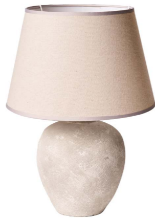
Cod: LC 104 Des: Lampada tonda grigio chiaro/paralume grigio Note: 10x53