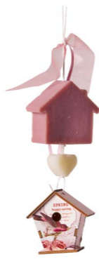
Cod: 7339/Ro Des: Gruppo sapone uccellino casetta rosa Note: altezza 20cm