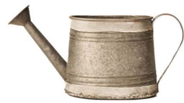
Cod: DM 5053 Des: Annaffiatoio Note: 32X11X16