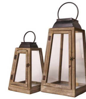
Cod: L 1336 Des: Set lanterne piramide con tetto piatto S/2 Note: piccola 21x21x37 grande 27x27x52,5