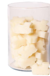
Cod: 4203/Bi Des: Sapone trenino piccolo (pz40) bianco Note: 5x4x1,7