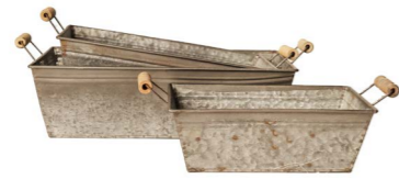
Cod: DM 5040 Des: Ceste rettangolari manici legno S/3 Note: 24x16x8, 30x19x9, 36x23x10