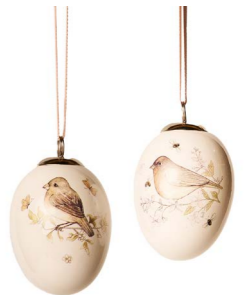
Cod: D 4506 Des: Ovetto in ceramica con uccellino Note: 5x5x8