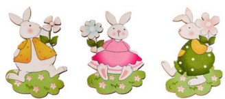
Cod: D 0544 Des: Confezione coniglietti in legno 24PZ Note: 2x5