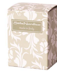
Cod: A 018/Ve Des: Scatola con stampa verde Note: 8x8x11