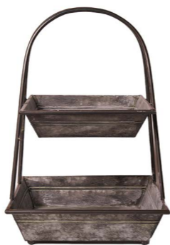
Cod: DM 2040 Des: Alzata due piani Note: 39x39x55