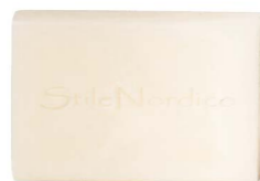
Cod: 4210 Des: Mattonella Stile Nordico bianco Note: 7,5x5x2,6