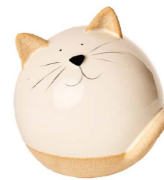
Cod: CK 951 Des: Gatto medio Note: 10x10x11