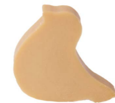
Cod: 4754/Bg Des: Sapone uccellino sottile beige Note: 8x6,5x1,7