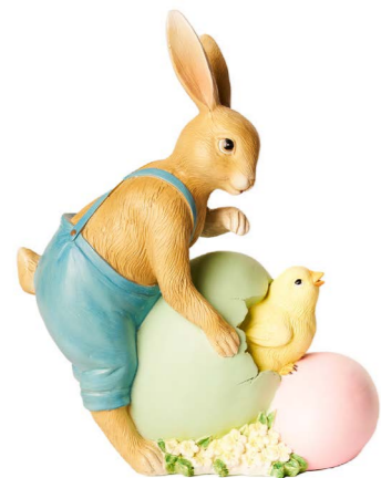
Cod: RS 1022 Des: Coniglietto con salopette Note: 18x9x23