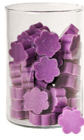
Cod: 4502/Vi Des: Sapone fiore medio (pz50) viola Note: 4x4x1,7