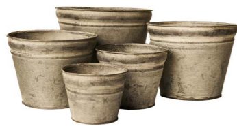
Cod: DM 5047 Des: Ceste rotonde senza manici S/5 Note: 25.5x20.5, 22x17.5, 20x15.5, 16x12.5, 13x10