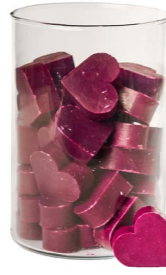
Cod: 4602/Pe Des: Sapone cuore medio (pz42) peonia Note: 4,5x4,2x1,7