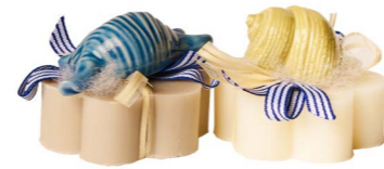
Cod: 7654 Des: Sapone decorato misto conchiglie Note: 8x8x6