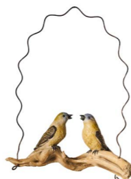
Cod: D 4501/Gi Des: Altalena con uccellini gialli Note: 22x9x28