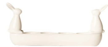
Cod: CK 679 Des: Portauovo lungo con coniglietti Note: 30x7x13