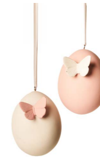
Cod: D 4505 Des: Ovetto da appendere rosa con farfalla bianca Note: 5x5x8,5