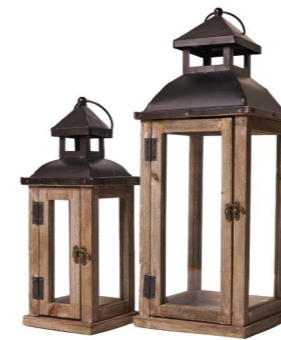
Cod: L 1335 Des: Set lanterne in legno con tetto in metallo S/2 Note: piccola 13,5x13,5x36 grande 19x19x50