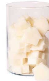
Cod: 4652/Bi Des: Sapone casetta media (42pz) bianco Note: 5x4x1,7