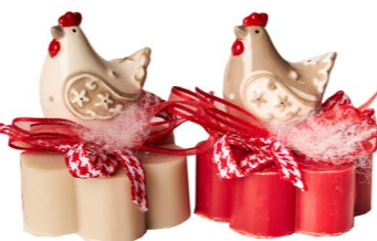
Cod: 7610/Rs Des: Sapone gallinella bianca/grigia Note: 8x8x8,5