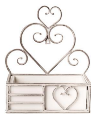
Cod: DM 5002 Des: Portapiante metallo piccola Note: 30x15x33