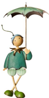
Cod: DM 2025 Des: Bambino seduto con ombrello Note: 20x15x60