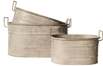
Cod: DM 5024 Des: Ceste rettangolari doppia riga S/3 Note: 40x25.5x20, 33.5x21.5x17, 27.5x18x14