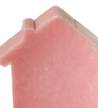
Cod: 4654/Ro Des: Sapone casetta rosa sottile Note: 8x7x1,7