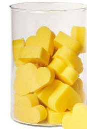
Cod: 4602/Gi Des: Sapone cuore medio (pz42) giallo Note: 4,5x4,2x1,7