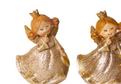
Cod: D 0418/Or Des: Angioletto oro Note: 5x3x7