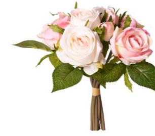
Cod: FB 153/Ro Des: Mazzo di rose rosa Note: 22cm altezza