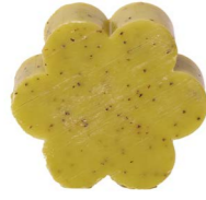
Cod: 4501/Ve Des: Sapone fiore grande verde Note: 8x8x3