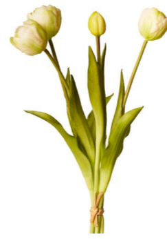
Cod: FB 165/Bi Des: Tulipani bianchi grandi Note: altezza 40cm