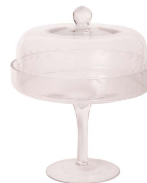
Cod: V 1218 Des: Alzata intagliata foglie Note: 23x23x28