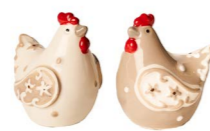
Cod: D 0253 Des: Gallinella in ceramica bianca/grigia Note: 5x4