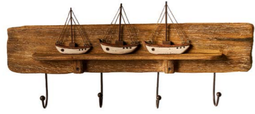
Cod: DL 3005 Des: Attaccapanni barchette a vela Note: 63x29