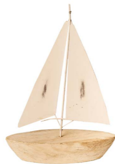
Cod: DM 2011 Des: Barca base legno grande Note: 22x8x33