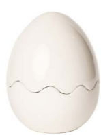
Cod: CK 864 Des: Scatola uovo grande Note: 11x11x15