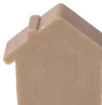
Cod: 4651/Gr Des: Sapone casetta grande grigia Note: 8x6,8x3