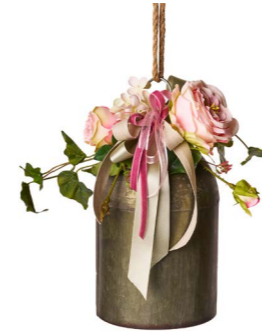
Cod: DM 1047-D Des: Campanaccio decorato rose Note: 16x28