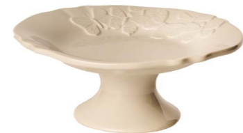
Cod: CK 956 Des: Alzata farfalle 22cm Note: 22x22x7