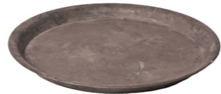
Cod: DM 5018 Des: Vassoio metallo grande Note: 50x50