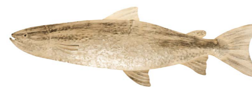
Cod: DM 2012 Des: Pesce lungo Note: 103x35