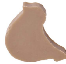
Cod: 4754/Gr Des: Sapone uccellino sottile grigio Note: 8x6,5x1,7