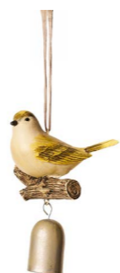
Cod: D 2037 Des: Uccellini gialli con campanella Note: 10x4x15