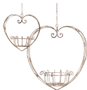
Cod: DM 5008 Des: Set fioriera a cuore 2pz Note: piccolo 40x23x35; grande 50x30x55