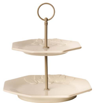
Cod: CK 957 Des: Alzata due piani farfalle Note: 24x24x25