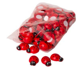
Cod: D 0541 Des: Coccinelle 72pz Note: 1x1