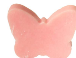
Cod: 4904/Ro Des: Sapone farfalla sottile rosa Note: 8x5,5x1,7