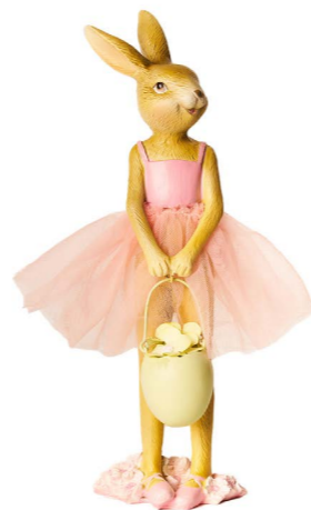
Cod: RS 1021 Des: Coniglietta con vestito ballerina Note: 12x7x24