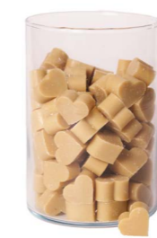
Cod: 4603/Bg Des: Sapone cuore piccolo (pz120) beige Note: 3x2,5x1,7