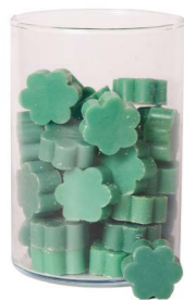
Cod: 4502/VEB Des: Sapone fiore medio (pz50) verde brillante Note: 4x4x1,7