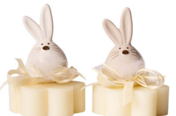
Cod: 7621/Bi Des: Sapone coniglio tondo bianco Note: 8x8x11