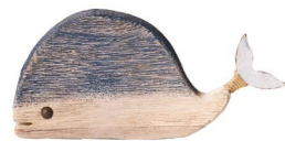
Cod: D 1511 Des: Balena in legno piccola Note: 18x2x10