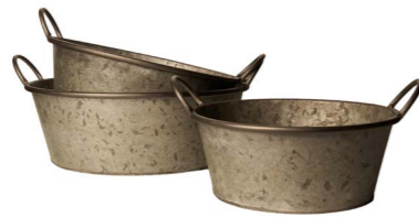
Cod: DM 5026 Des: Ceste rotonde con manici vintage S/3 Note: 42x14.5, 37x13.5, 32x12.5