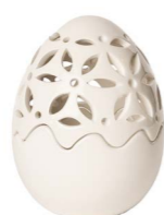
Cod: CK 868 Des: Scatola Uovo intagliata medio Note: 11x11x15