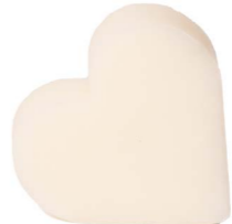
Cod: 4604/Bi Des: Sapone cuore sottile bianco Note: 6,8x6,5x1,7