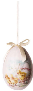
Cod: D 6509 Des: Ovetto con pulcino giallo Note: altezza 10cm