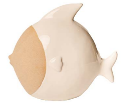
Cod: CK 852 Des: Pesce palla grande Note: 22x10x20