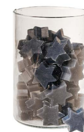
Cod: 4802/BL Des: Sapone stella media (pz60) blu Note: 4,4x3,8x1,7