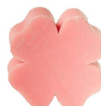
Cod: 4301/Ro Des: Sapone quadrifoglio grande rosa Note: 7,3x7,3x3