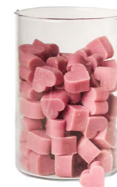
Cod: 4603/Roa Des: Sapone cuore piccolo (pz120) rosa antico Note: 3x2,5x1,7