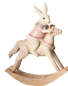
Cod: RS 1017 Des: Coniglietto su cavallo a dondolo Note: 16x6x20