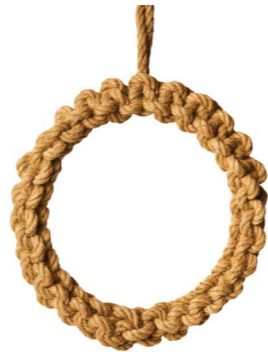
Cod: CN 5051 Des: Corona corda intrecciata maxi Note: diam esterno 30cm