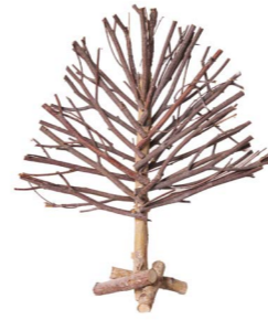
Cod: DL 0023 Des: Albero gelso grande Note: 36x5x50