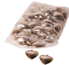
Cod: D 0511 Des: Cuore argento liscio grande 50pz. Note: 1x1x1