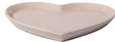
Cod: CK 056/To Des: Piatto a forma di cuore tortora Note: 20x21x2