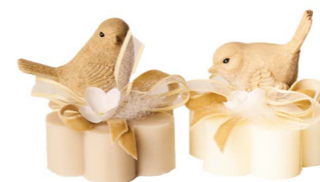
Cod: 7572/Bg Des: Sapone uccellino in resina beige Note: 8x8x8,5