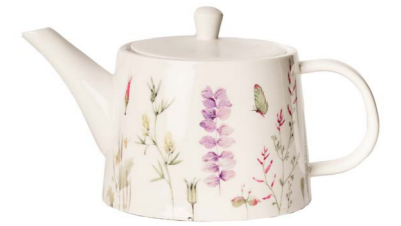
Cod: CK 512 Des: Teiera Primavera Note: 24x12x13