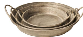
Cod: DM 5015 Des: Set Vassoi metallo con manici Note: p 45x7H m 38x6H g 30x5H