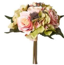
Cod: FB 154 Des: Bouquet di rose/ortensie Note: 26cm altezza