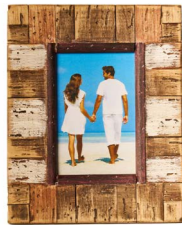
Cod: DL 3020 Des: Cornice in legno piccola Note: 20x25