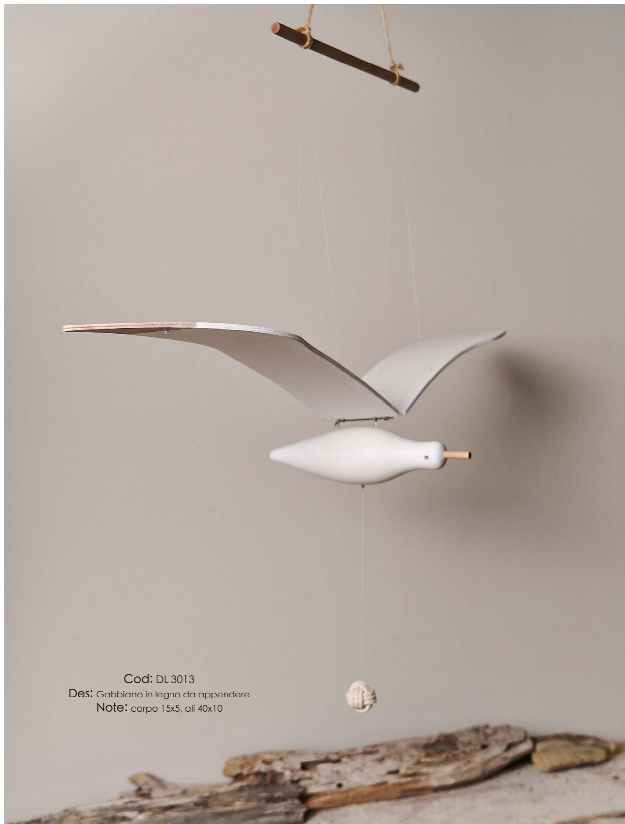
Cod: DL 3013 Des: Gabbiano in legno da appendere Note: corpo 15x5, ali 40x10