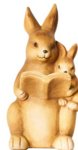
Cod: CK 943 Des: Coppia coniglietti con libro Note: 10x10x21