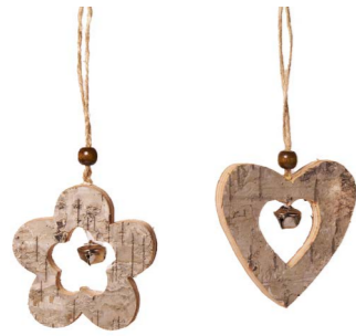
Cod: D 2032 Des: Formine assortite da appendere in legno Note: 10x0,5x10