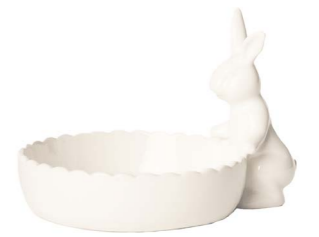
Cod: CK 691 Des: Ciotolina con coniglietto grande Note: 17x13x11