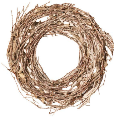
Cod: CN 5043 Des: Corona rametti sbiancati 30cm Note: diam esterno 30cm