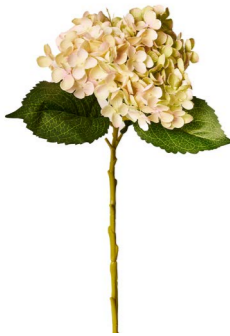
Cod: FB 155/VR Des: Ortensia verde/rosa Note: 50cm