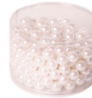
Cod: D 0515 Des: Confezione perle 210pz. Note: 1x1x1