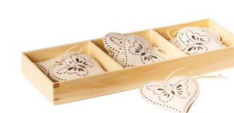
Cod: D 2040 Des: Decorazione metallo cuore farfalle 6pz. Note: 5x5