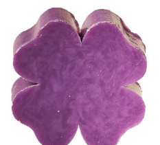
Cod: 4301/Vi Des: Sapone quadrifoglio grande viola Note: 7,3x7,3x3