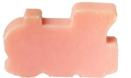
Cod: 4204/Ro Des: Sapone trenino sottile rosa Note: 6x5x1,7