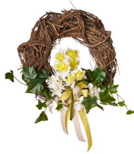
Cod: CN 5013/Gi Des: Corona rami naturali decorata Giallo Note: diam esterno 30cm