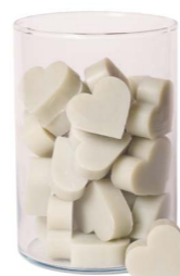
Cod: 4602/Veq Des: Sapone cuore medio (pz42) verde aquamarina Note: 4,5x4,2x1,7