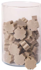
Cod: 4303/Gr Des: Sapone quadrifoglio piccolo (pz65) grigio Note: 3,5x3,5x1,7