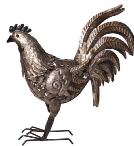
Cod: DM 2038 Des: Gallina metallo grigia Note: 42x18x43