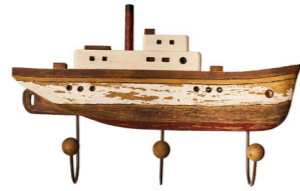
Cod: DL 3000 Des: Attaccapanni nave Note: 60x30