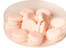
Cod: D 0450/RO Des: Mini macarons rosa 12pz Note: 22mm