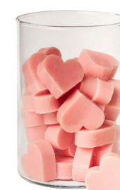
Cod: 4602/Ro Des: Sapone cuore medio (pz42) rosa Note: 4,5x4,2x1,7