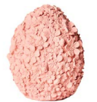
Cod: RS 1010/RO Des: Uovo piccolo con fiorellini rosa Note: 9x9x12