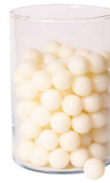
Cod: 4010/Bi Des: Sapone perle (pz125) bianche Note: 2,5x2,5