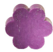
Cod: 4501/Vi Des: Sapone fiore grande viola Note: 8x8x3