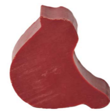
Cod: 4751/Bx Des: Sapone uccellino grande bordeaux Note: 8x6x3