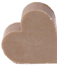
Cod: 4601/Gr Des: Sapone cuore grande grigio Note: 6,8x6,5x3