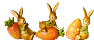
Cod: D 0460/Ar Des: Coniglietti con carota arancione S/4 Note: 6,5x4x7