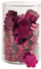
Cod: 4502/Pe Des: Sapone fiore medio (pz50) peonia Note: 4x4x1,7