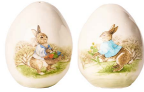
Cod: CK 836 Des: Sale e pepe ovetto coniglietto Note: 6x6x8