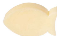
Cod: 4101/Bi Des: Sapone pesce grande bianco Note: 7x5x3