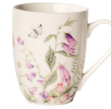
Cod: CK 510 Des: Mug Primavera Note: 11x8x10