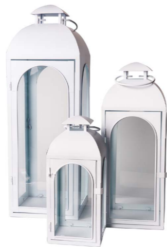
Cod: L 1344 Des: Set lanterne in metallo bianco S/3 Note: 14x32, 19x47, 22x35