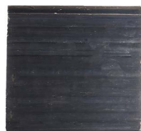
Cod: 4011/BL Des: Sapone mattoncino blu Note: 8x6x1,8