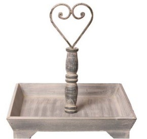
Cod: DL 5005 Des: Espositore in legno naturale 1 piani Note: 30x30x33