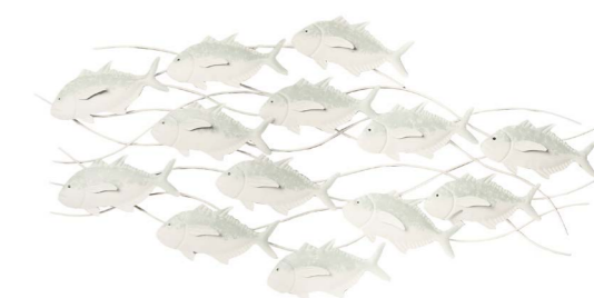
Cod: DM 2016 Des: Quadro pesci orizzontale Note: 115x55