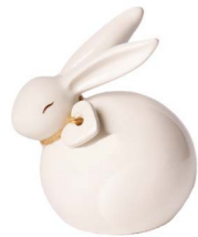
Cod: CK 839 Des: Coniglietto piccolo con cuore Note: 6x4x7