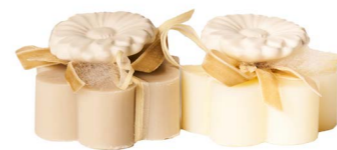
Cod: 7620/Bi Des: Sapone decorato fiore bianco Note: 8x8x5