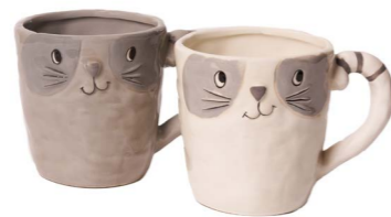
Cod: CK 503 Des: Tazza gattino bianco/grigio Note: 13x10x10