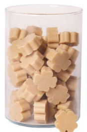
Cod: 4303/Bg Des: Sapone quadrifoglio piccolo (pz65) beige Note: 3,5x3,5x1,7