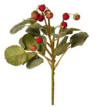
Cod: FB 167 Des: Mazzetto fragoline Note: 29cm altezza