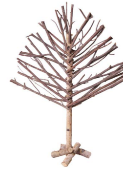
Cod: DL 0022 Des: Albero gelso piccolo Note: 31x5x40