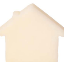
Cod: 4654/Bi Des: Sapone casetta bianca sottile Note: 8x7x1,7