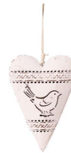
Cod: D 2044 Des: Cuore grande con disegno uccellino Note: 6x11