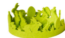
Cod: F199/VE Des: Nastro feltro coniglietti 1m verde Note: 8x100