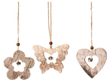
Cod: D 2034 Des: Formine da appendere in legno Note: 10x0,5x10