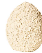
Cod: RS 1011/Bi Des: Uovo grande con fiorellini bianco Note: 12x12x16