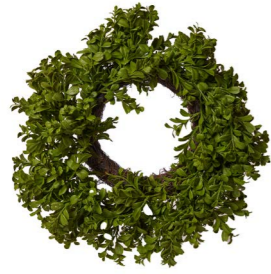
Cod: CN 6043 Des: Corona bossolo media Note: diam interno 23cm