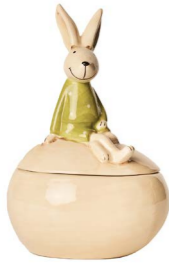
Cod: CK 687 Des: Scatola uovo coniglietto seduto Note: 11x8x17