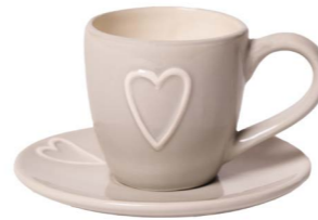
Cod: CK 050/To Des: Tazza da caffè con cuore tortora Note: piattino 12x12; tazzina 10x6x7