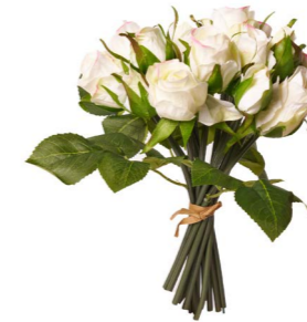
Cod: FB 158 Des: Mazzetto roselline bianche Note: 25cm altezza