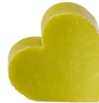
Cod: 4601/Vem Des: Sapone cuore grande verde mughetto Note: 6,8x6,5x3