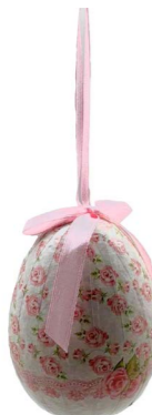
Cod: D 6507 Des: Ovetto con rose Note: altezza 10cm