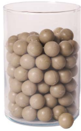
Cod: 4010/Gr Des: Sapone perle (pz125) grigie Note: 2,5x2,5