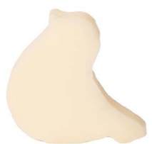
Cod: 4754/Bi Des: Sapone uccellino sottile bianco Note: 8x6,5x1,7