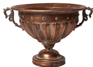
Cod: DM 5061 Des: Coppa in metallo grande Note: 40x40x35