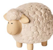
Cod: CK 854 Des: Pecorella in ceramica grande Note: 18x12x14