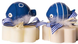
Cod: 7658 Des: Sapone decorato pesciolino blu Note: 8x8x9