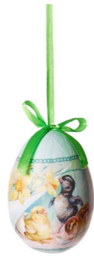
Cod: D 6510 Des: Ovetto con pulcini giallo Note: altezza 10cm