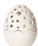
Cod: CK 867 Des: Scatola Uovo intagliata piccola Note: 7x7x12