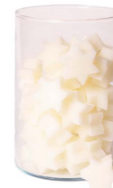
Cod: 4802/Bi Des: Sapone stella media (pz60) bianca Note: 4,4x3,8x1,7