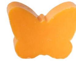
Cod: 4901/Ar Des: Sapone farfalla grande arancione Note: 8x5,5x3