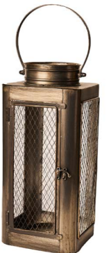
Cod: L 1316 Des: Lanterna con rete piccola Note: 15x15x27