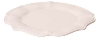
Cod: CK 002 Des: Piatto rotondo in ceramica Note: 33x33x2