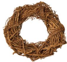
Cod: CN 5013 Des: Corona rami naturali 30cm Note: diam esterno 30cm