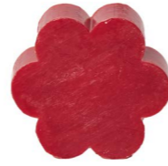
Cod: 4501/RS Des: Sapone fiore grande rosso Note: 8x8x3