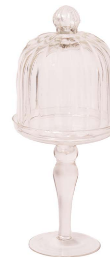
Cod: V 1226 Des: Alzata monocake rigata 26cm Note: 12x12x28