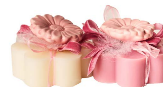
Cod: 7620/Ro Des: Sapone decorato fiore rosa Note: 8x8x5