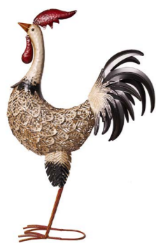
Cod: DM 2037 Des: Gallo colorato grande Note: 40x15x55