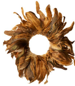
Cod: CN 6009 Des: Corona con piume piccola Note: diam esterno 20cm