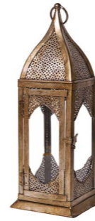
Cod: L 1326 Des: Lanterne Marrakesh piccola Note: 15x15x45