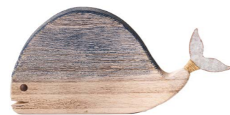
Cod: D 1512 Des: Balena in legno grande Note: 22x2x13