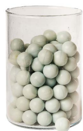
Cod: 4010/Az Des: Sapone perle (pz125) azzurro Note: 2,5x2,5