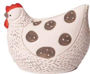
Cod: CK 845 Des: Gallina in ceramica con pois grande Note: 19x10x17