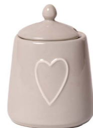
Cod: CK 055/To Des: Zuccheriera con cuore tortora Note: 9x8x12,5