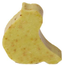
Cod: 4751/Ve Des: Sapone uccellino grande verde Note: 8x6x3