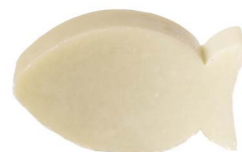
Cod: 4101/Veq Des: Sapone pesce grande tiffany Note: 7x5x3