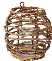
Cod: L 1401 Des: Lanterna legnetti piccola Note: 15x15x21