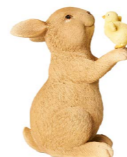
Cod: RS 1025 Des: Coniglietto grande con pulcino Note: 10x8x14