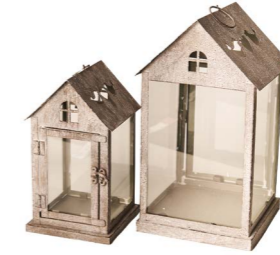
Cod: L 1207/Gr Des: Set lanterne intagliate cuore uccellino grigie Note: 12,5x12,5x22 - 17x17x30,5