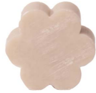
Cod: 4501/To Des: Sapone fiore grande tortora Note: 8x8x3