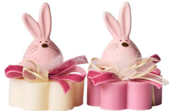
Cod: 7621/Ro Des: Sapone decorato coniglio tondo rosa Note: 8x8x11