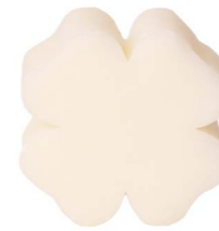
Cod: 4301/Bi Des: Sapone quadrifoglio grande bianco Note: 7,3x7,3x3