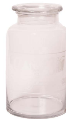
Cod: V 1217 Des: Biscottiera "Candy shop" grande Note: 16,5x16,5x28