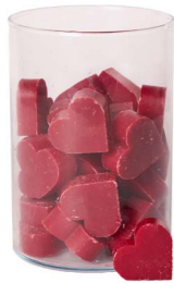
Cod: 4602/RS Des: Sapone cuore medio (pz42) rosso Note: 4,5x4,2x1,7