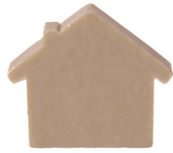
Cod: 4654/Gr Des: Sapone casetta sottile grigio Note: 8x7x1,7