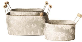
Cod: DM 5043 Des: Ceste rettangolari disegno fiori S/3 Note: 23x14x9, 26x27x11, 30x22x12