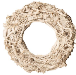
Cod: R 0021/Bi Des: Corona bastoncino/vite 45cm bianca Note: 45x45x10