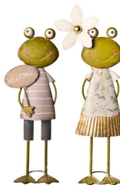
Cod: DM 2021 Des: Coppia rane Note: 20x15x60