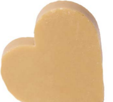
Cod: 4604/Bg Des: Sapone cuore sottile beige Note: 6,8x6,5x1,7