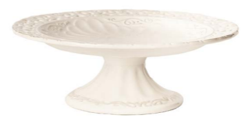
Cod: CK 4511M Des: Alzata ceramica 25cm Note: 25x25x10