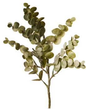
Cod: FB 170 Des: Ramo eucalipto Note: 30cm