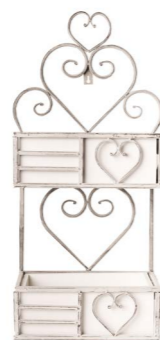
Cod: DM 5003 Des: Portapiante metallo grande Note: 30x15x65