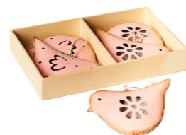
Cod: D 1500/Ro Des: Confezione uccellini in metallo rosa Note: 9x6