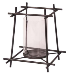
Cod: DM 1065 Des: Portacandela bastoni incrociati piccolo Note: 22x22x23