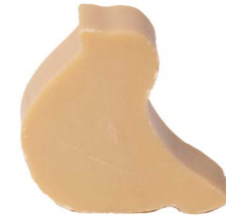
Cod: 4751/Bg Des: Sapone uccellino grande beige Note: 8x6x3