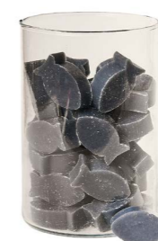
Cod: 4102/BL Des: Sapone pesce medio (pz50) blu Note: 4x3x1,7