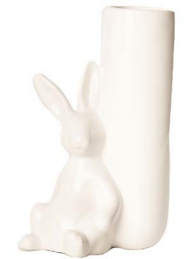
Cod: CK 689 Des: Vaso fiore con coniglietto Note: 11x17x17