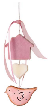
Cod: 7950/Ro Des: Gruppo sapone uccellino metallo rosa Note: 20cm