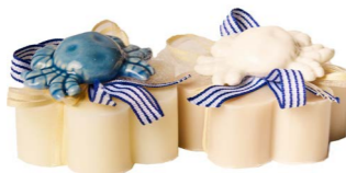
Cod: 7667 Des: Sapone decorato granchietto Note: 8x8x6