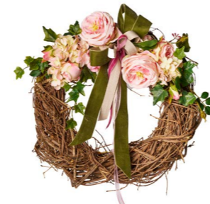
Cod: CN 5014/Ro Des: Corona rami naturali decorata Rosa Note: diam esterno 38cm