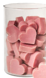
Cod: 4602/Roa Des: Sapone cuore medio (pz42) rosa antico Note: 4,5x4,2x1,7