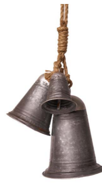
Cod: DM 1036 Des: Tris campanacci Note: grande 20x20x24