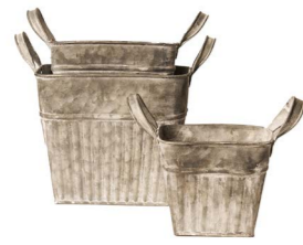
Cod: DM 5042 Des: Ceste quadrate con manici Note: 12x12x10, 15x15x13, 18x18x15