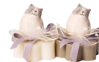
Cod: 7617 Des: Sapone decorato gatto grigio Note: 8x8x8,5