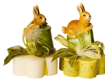
Cod: 7627 Des: Sapone coniglio con secchiello Note: 8x8x8,5