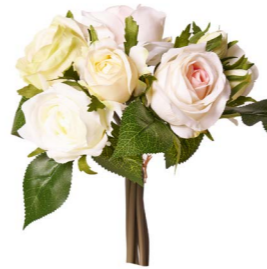
Cod: FB 153/Bi Des: Mazzo di rose bianco Note: 22cm altezza