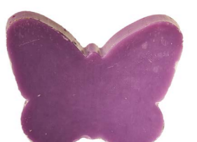
Cod: 4904/Vi Des: Sapone farfalla sottile viola Note: 8x5,5x1,7