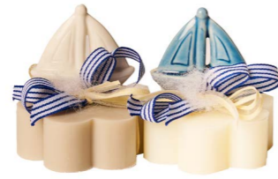
Cod: 7653 Des: Sapone decorato barchetta Note: 8x8x9