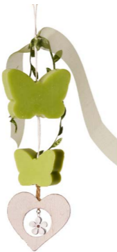
Cod: 7951/Ve Des: Gruppo sapone verde cuore legno Note: 20cm