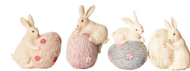
Cod: RS 1019 Des: Coniglietti con ovetti glitter S/4 Note: 8x5x10