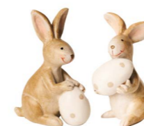
Cod: D 0461 Des: Coniglietti con uova a pois S/2 Note: 6,5x4x7