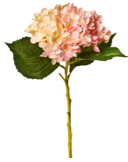
Cod: FB 155/RO Des: Ortensia rosa Note: 50cm