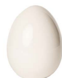
Cod: CK 860 Des: Uovo in ceramica medio Note: 11x11x15