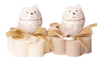
Cod: 7618 Des: Sapone decorato gatto beige Note: 8x8x8,5