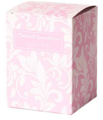
Cod: A 018/Ro Des: Scatola con stampa rosa Note: 8x8x11