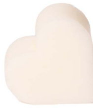
Cod: 4601/Bi Des: Sapone cuore grande bianco Note: 6,8x6,5x3