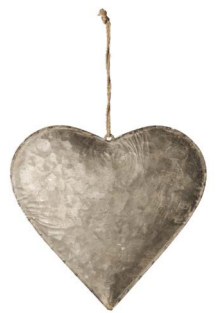
Cod: DM 5014 Des: Cuore in metallo grande Note: 23x23