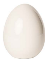
Cod: CK 861 Des: Uovo in ceramica grande Note: 14x14x20