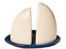
Cod: CK 842 Des: Sale e pepe barchetta Note: 10x6x7