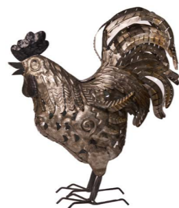
Cod: DM 2039 Des: Gallo metallo grigio Note: 42x18x55