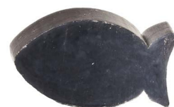
Cod: 4101/BL Des: Sapone pesce grande blu Note: 7x5x3