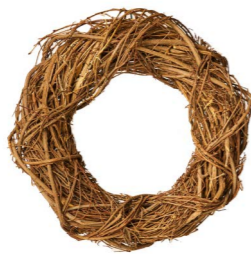
Cod: CN 5014 Des: Corona rami naturali 38cm Note: diam esterno 38cm