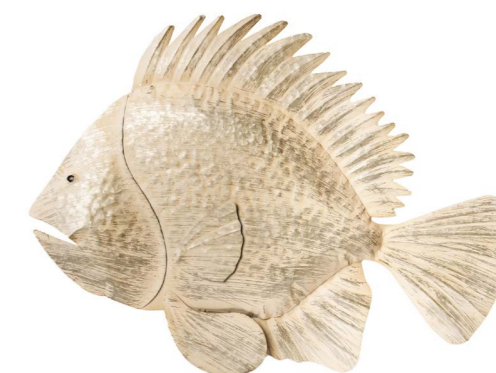
Cod: DM 2013 Des: Pesce palla Note: 76x50