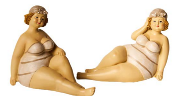
Cod: RS 2000 Des: Coppia bagnanti sedute Note: 14x7x11