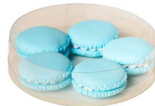
Cod: D 0451/AZ Des: Macarons azzurri 5pz Note: 37mm