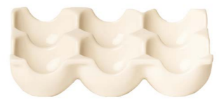
Cod: CK 681 Des: Portauovo rettangolare 6uova Note: 15x9x4