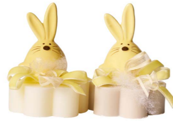
Cod: 7621/Gi Des: Sapone coniglio tondo giallo Note: 8x8x11