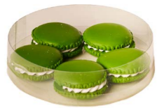
Cod: D 0451/VE Des: Macarons verdi 5pz Note: 37mm