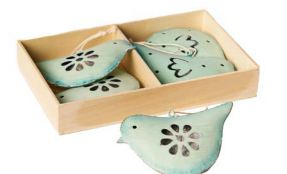
Cod: D 1500/Az Des: Confezione uccellini in metallo azzurro Note: 9x6