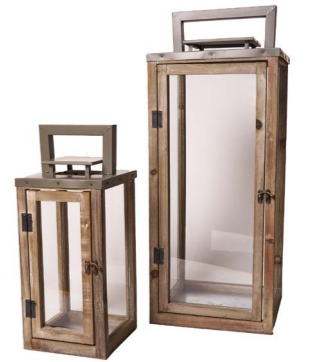
Cod: L 1337 Des: Set lanterne quadrate con tetto in metallo S/2 Note: piccola 17,3x17,3x42 grande 25,8x25,8x64,8