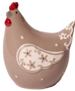
Cod: CK 931 Des: Gallina con ala pizzo grigia piccola Note: 11x8x13