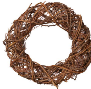
Cod: CN 5015 Des: Corona rami naturali 48cm Note: diam interno 28cm; diam est 48cm