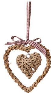
Cod: R 0147/Gr Des: Cuore con cuore appeso piccolo grigio Note: 15x15