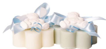
Cod: 7603 Des: Sapone decorato orsetto gesso Note: 8x8x8,5