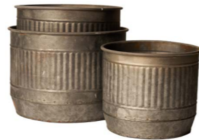
Cod: DM 5048 Des: Ceste rotonde rigate con manici S/3 Note: 22x22x15.5, 20x20x14, 17x17x13.5