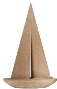
Cod: DL 2001 Des: Barca grande con vele legno Note: 45x12x65