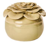
Cod: CK 936/Veq Des: Scatola con fiore verde Note: 11,5x11,5x9