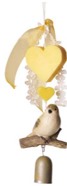
Cod: 7353/Gi Des: Gruppo sapone uccellino campanella giallo Note: altezza 20cm