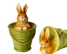
Cod: D 0462 Des: Coniglietti con secchiello S/4 Note: 6x4x7