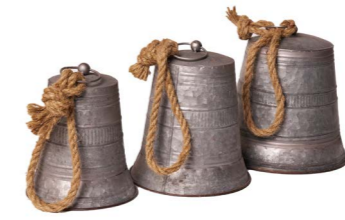
Cod: DM 5054 Des: Set campanelle s/3 Note: diam p 16cm; m 18cm; g 20x20x22