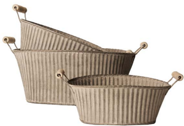
Cod: DM 5046 Des: Ceste ovali rigate con manici S/3 Note: 34.5x25.5x15, 29x23x12, 23x19x9.5