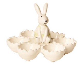
Cod: CK 682 Des: Portauovo rotondo con coniglietto Note: 16x16x12