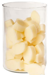
Cod: 4102/Bi Des: Sapone pesce medio (pz50) bianco Note: 4x3x1,7