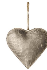
Cod: DM 5013 Des: Cuore in metallo piccolo Note: 18x18