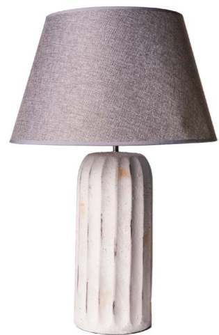
Cod: LC 102 Des: Lampada grande bianca/paralume grigio Note: 17x70