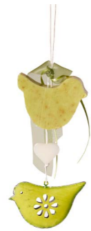
Cod: 7950/Ve Des: Gruppo sapone uccellino metallo verde Note: 20cm