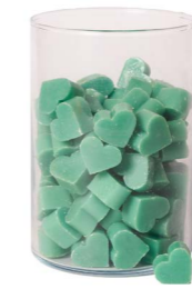
Cod: 4603/VeB Des: Sapone cuore piccolo (pz120) verde brillante Note: 3x2,5x1,7