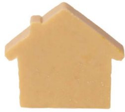
Cod: 4654/Bg Des: Sapone casetta sottile beige Note: 8x7x1,7