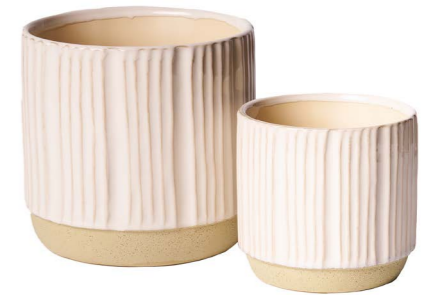
Cod: CK 011 Des: Set vasi con righe verticali Note: 12x11, 15x15