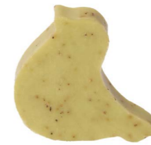
Cod: 4754/Ve Des: Sapone uccellino sottile verde Note: 8x6,5x1,7