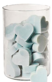
Cod: 4602/Az Des: Sapone cuore medio (pz42) azzurro Note: 4,5x4,2x1,7