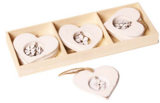
Cod: D 2047 Des: Conf. 9pz. in legno cuore con fiorellino appeso Note: 10x0,5x10