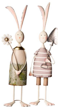
Cod: DM 2027 Des: Coppia conigli grandi Note: 25x15x70