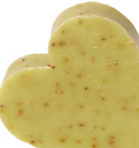
Cod: 4604/Ve Des: Sapone cuore sottile verde Note: 6,8x6,5x1,7