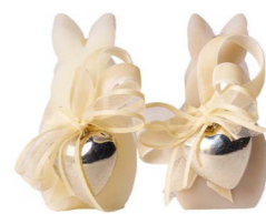
Cod: 7460/Bi Des: Sapone coniglietto decorato bianco Note: 4x3x7