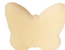
Cod: 4904/Bi Des: Sapone farfalla sottile bianco Note: 8x5,5x1,7