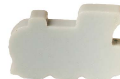
Cod: 4204/Az Des: Sapone trenino sottile azzurro Note: 6x5x1,7