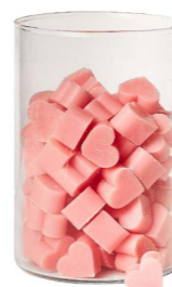
Cod: 4603/Ro Des: Sapone cuore piccolo (pz120) rosa antico Note: 3x2,5x1,7