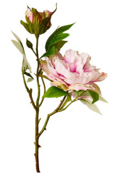
Cod: FB 157 Des: Peonia rosa Note: altezza 50cm