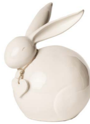
Cod: CK 840 Des: Coniglietto medio con cuore Note: 9x7x10