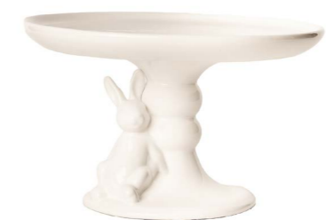
Cod: CK 692 Des: Alzata con coniglietto Note: 25x25x12