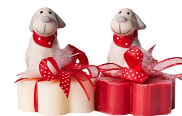
Cod: 7619 Des: Sapone decorato cagnolino Note: 8x8x8,5