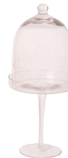
Cod: V 1219 Des: Alzata intagliata foglie Note: 15x15x34