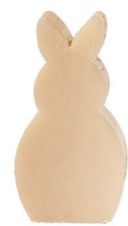
Cod: 4151/Bg Des: Sapone coniglio grande beige Note: 5x8x3