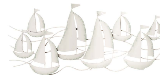
Cod: DM 2014 Des: Quadro vele orizzontale Note: 90x50