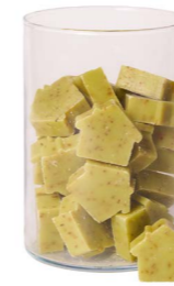
Cod: 4652/Ve Des: Sapone casetta media (42pz) verde Note: 5x4x1,7