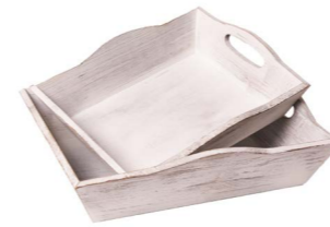
Cod: DL 5000 Des: Set vassoi in legno con manici 2PZ Note: piccolo 29x24x6; grande 35x30x6