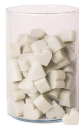
Cod: 4603/Veq Des: Sapone cuore piccolo (pz120) verde aquamarina Note: 3x2,5x1,7