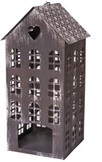
Cod: L 1242 Des: Lanterna con tetto con cuori grande Note: 18x10x40