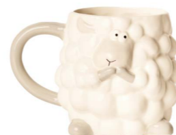
Cod: CK 504 Des: Tazza pecorella Note: 13x10x10