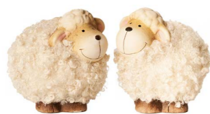
Cod: CK 940 Des: Pecorelle lana piccole Note: 8x6x9