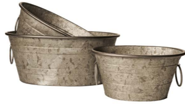
Cod: DM 5025 Des: Ceste rettangolari manici tondi S/3 Note: 37.5X29X16, 31X24X15, 27X20.5X13