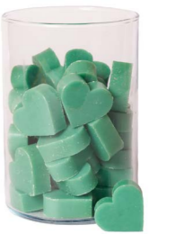
Cod: 4602/VeB Des: Sapone cuore medio (pz42) verde brillante Note: 4,5x4,2x1,7