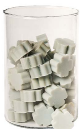
Cod: 4303/Az Des: Sapone quadrifoglio piccolo (pz65) azzurro Note: 3,5x3,5x1,7