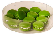
Cod: D 0450/VE Des: Mini macarons verde 12pz Note: 22mm