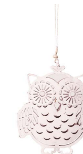
Cod: D 2226 Des: Gufetto in metallo bianco grande Note: 6x9