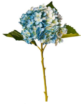
Cod: FB 155/AZ Des: Ortensia azzurra Note: 50cm