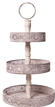
Cod: DM 5005 Des: Espositore 3 piani in metallo bianco Note: 30x30x56