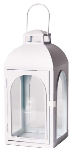
Cod: L 1250 Des: Lanterna in metallo bianco Note: Altezze 14x14x30