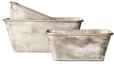
Cod: DM 5027 Des: Vaschette rettangolari in metallo S/3 Note: 39X21.5X16, 33.5X19X14, 29X16X12