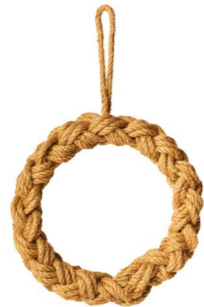
Cod: CN 5050 Des: Corona corda intrecciata laccio Note: diam esterno 45cm