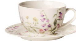
Cod: CK 511 Des: Tazza da tè Primavera Note: piattino 15x15; tazzina 13x10x6