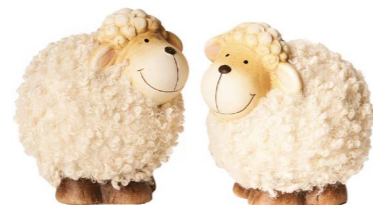
Cod: CK 941 Des: Pecorelle lana medie Note: 12x9x13