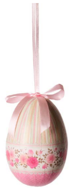
Cod: D 6508 Des: Ovetto con fascia rose Note: altezza 10cm