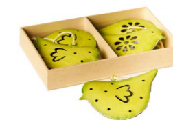
Cod: D 1500/Ve Des: Confezione uccellini in metallo verde Note: 9x6