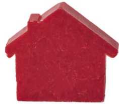
Cod: 4654/RS Des: Sapone casetta sottile rossa Note: 8x7x1,7