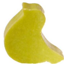
Cod: 4751/Vem Des: Sapone uccellino grande mughetto Note: 8x6x3