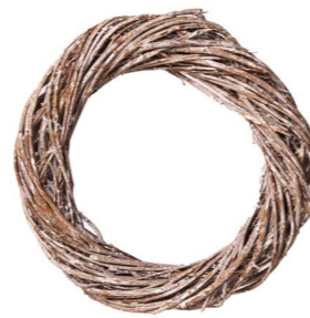
Cod: CN 5032 Des: Corona salice grande Note: diam interno 27cm; diam esterno 40cm