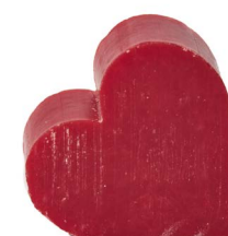
Cod: 4601/RS Des: Sapone cuore grande rosso Note: 6,8x6,5x3