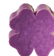
Cod: 4301/Vi Des: Sapone quadrifoglio grande viola Note: 7,3x7,3x3