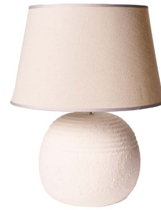
Cod: LC 100 Des: Lampada tonda bianca/paralume grigio Note: 25x53