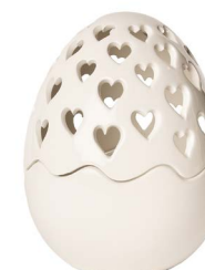
Cod: CK 869 Des: Scatola Uovo intagliata grande Note: 14x14x20