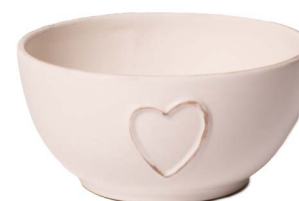
Cod: CK 048/Bi Des: Ciotola in ceramica cuore bianca Note: 12x12x6,5