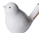
Cod: D 0261/BI Des: Uccellino bianco Note: 5x6x4