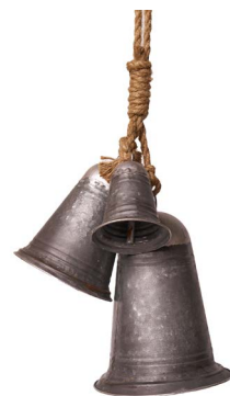
Cod: DM 1036 Des: Tris campanacci Note: grande 20x20x24