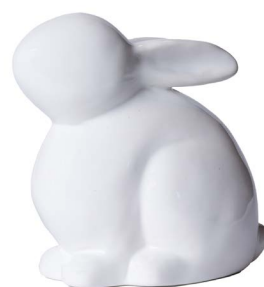
Cod: CK 875 Des: Coniglio grande in ceramica Note: 15x11x17cm