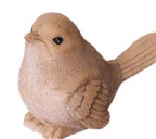
Cod: D 0459/Bg Des: Uccellino in resina beige Note: 5x3x7