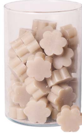
Cod: 4502/To Des: Sapone fiore medio (pz50) tortora Note: 4x4x1,7