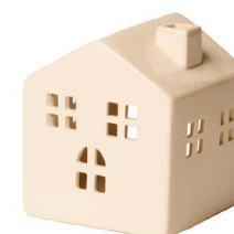
Cod: CK 005 Des: Casetta in ceramica mini Note: 7x7x8