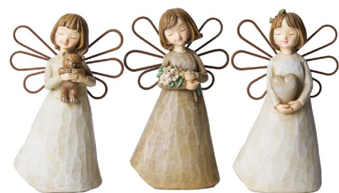
Cod: RS 1031 Des: Angioletti beige assortiti piccoli Note: 8x4x11cm