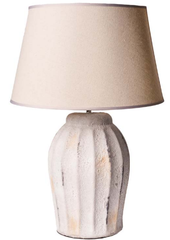
Cod: LC 101 Des: Lampada media bianca/paralume crema Note: 18x59