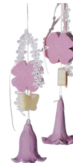
Cod: 7354/RO Des: Gruppo sapone campanella fiore rosa Note: 9x20