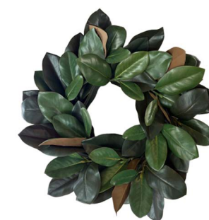
Cod: CN 5049 Des: Corona magnolia Note: diametro int 24cm, est 60cm