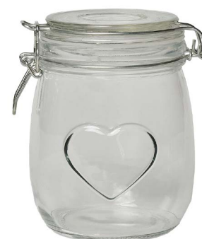
Cod: V 1011 Des: Barattolo bormioli cuore medio Note: 10x10x14