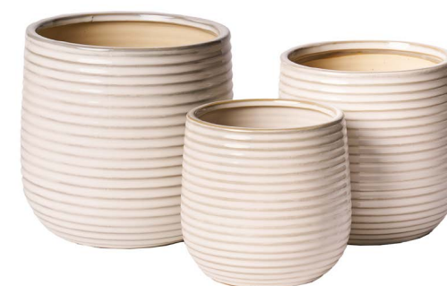
Cod: CK 012 Des: Tris vasi con righe orizzontali Note: 11x11, 13x13, 15x15