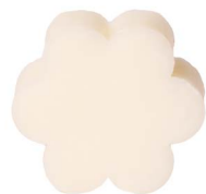
Cod: 4501/Bi Des: Sapone fiore grande bianco Note: 8x8x3