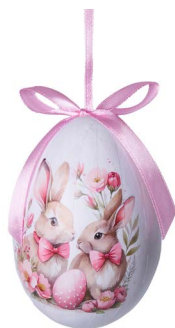
Cod: D 6514 Des: Ovetto coniglietti rosa Note: altezza 10cm