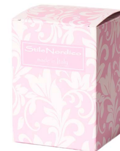
Cod: A 018/Ro Des: Scatola con stampa rosa Note: 8X8X11