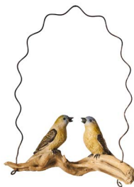
Cod: D 4501/Gi Des: Altalena con uccellini gialli Note: 22x9x28