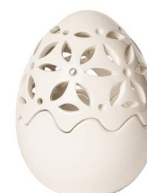
Cod: CK 868 Des: Scatola Uovo intagliata medio Note: 11x11x15