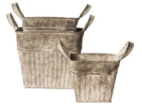
Cod: DM 5042 Des: Ceste quadrate con manici Note: 12x12x10, 15x15x13, 18x18x15