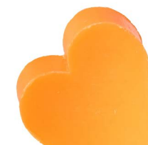
Cod: 4601/Ar Des: Sapone cuore grande arancione Note: 6,8x6,5x3