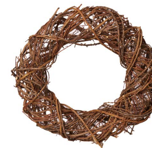
Cod: CN 5015 Des: Corona rami naturali 48cm Note: diam interno 28cm; diam esterno 48cm