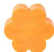
Cod: 4501/Ar Des: Sapone fiore grande arancione Note: 8x8x3