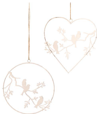
Cod: D 1516 Des: Cuore cerchio con uccellini Note: 20x20x2