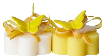
Cod: 7627/Gi Des: Sapone decorato farfalla gialla Note: 8x8x6