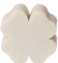
Cod: 4301/Veq Des: Sapone quadrifoglio grande tiffany Note: 7,3x7,3x3