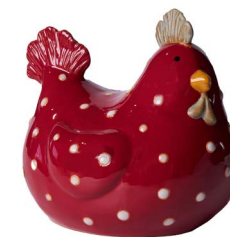
Cod: CK 968 Des: Gallina a pois media Note: 14x13x15cm