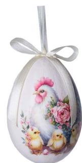
Cod: D 6517 Des: Ovetto con pulcini e fiori Note: altezza 10cm