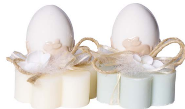
Cod: 7601/VEQ Des: Sapone decorato con uova tiffany Note: 8x8x10