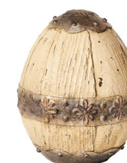
Cod: RS 1012 Des: Uovo in resina piccolo Note: 11x11x15