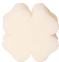
Cod: 4301/Bi Des: Sapone quadrifoglio grande bianco Note: 7,3x7,3x3