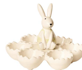
Cod: CK 682 Des: Portauovo rotondo con coniglietto Note: 16x16x12