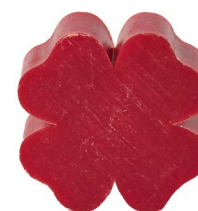
Cod: 4301/Rs Des: Sapone quadrifoglio grande rosso Note: 7,3x7,3x3