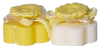
Cod: 7620/Gi Des: Sapone decorato fiore giallo Note: 8x8x5