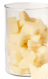
Cod: 4902/Bi Des: Sapone farfalla medio (pz36) bianco Note: 4,5x4x1,7