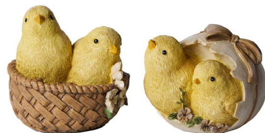
Cod: RS 1028 Des: Coppia pulcini su cesta Note: 8x8x9 - 10x8x7cm