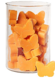
Cod: 4902/Ar Des: Sapone farfalla medio (pz36) arancio Note: 4,5x4x1,7