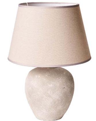
Cod: LC 104 Des: Lampada tonda grigio chiaro/paralume grigio Note: 10x53