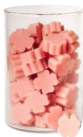
Cod: 4303/Ro Des: Sapone quadrifoglio piccolo (pz65) rosa Note: 3,5x3,5x1,7