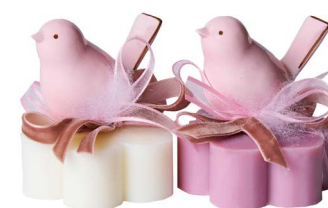
Cod: 7608/RO Des: Sapone decorato uccellino rosa Note: 8x8x10