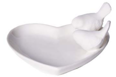
Cod: CK 831 Des: Piattino a cuore con uccellini Note: 14x13x5