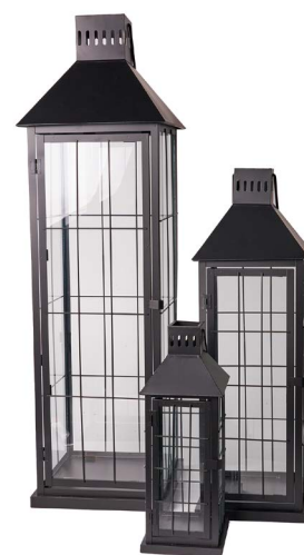
Cod: L 1340 Des: Lanterne metallo nero struttura quadri S/3 Note: 13x35, 18x42, 25x90