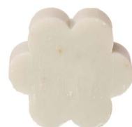
Cod: 4501/Veq Des: Sapone fiore grande tiffany Note: 8x8x3