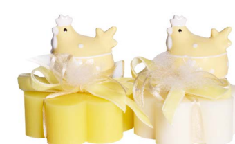
Cod: 7613/GI Des: Sapone decorato gallina giallo Note: 8x8x10