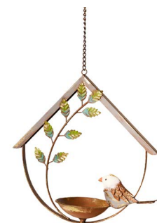
Cod: DM 2024 Des: Casetta per uccellini Note: 28x8x35