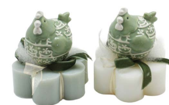
Cod: 7613/VE Des: Sapone decorato gallina verde Note: 8x8x10