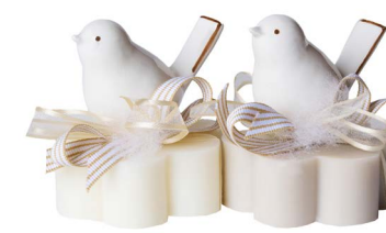
Cod: 7608/BI Des: Sapone decorato uccellino bianco Note: 8x8x10