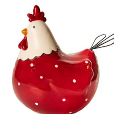
Cod: CK 939 Des: Gallina rossa grande con pois Note: 18x13x18