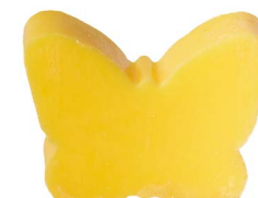
Cod: 4901/Gi Des: Sapone farfalla grande giallo Note: 8x5,5x3