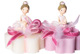
Cod: 7610 Des: Sapone decorato ballerina Note: 8x8x10