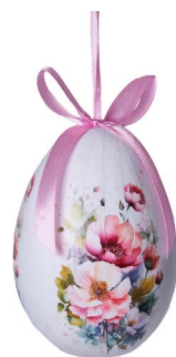
Cod: D 6518 Des: Ovetto mazzo fiori colorati Note: altezza 10cm