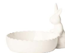
Cod: CK 691 Des: Ciotolina con coniglietto piccolo Note: 14x11x9