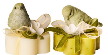
Cod: 7572/Ve Des: Sapone decorato uccellino resina verde Note: 8x8x8,5