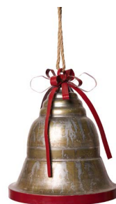
Cod: DM 1103 Des: Campana liscia grande con fiocco rosso Note: 34x34x40