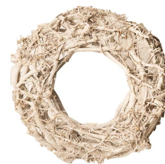
Cod: R 0021/BI Des: Corona bastoncino/vite 45cm bianca Note: 45x45x10