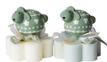
Cod: 7607/VE Des: Sapone decorato pecorella verde Note: 8x8x10