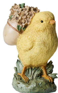
Cod: RS 1027 Des: Pulcino con cesto fiori Note: 7x5,5x9,5cm