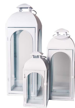
Cod: L 1344 Des: Set lanterne in metallo bianco S/3 Note: 14x32, 19x47, 22x35