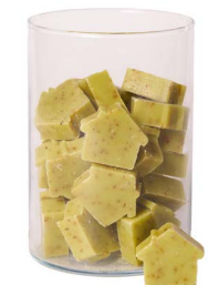
Cod: 4652/Ve Des: Sapone casetta media (42pz) verde Note: 5x4x1,7