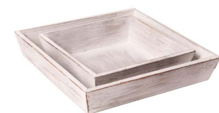
Cod: DL 5001 Des: Set vassoi in legno quadrati 2PZ Note: piccolo 22x22x6; grande 30x30x6