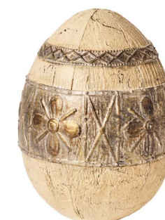
Cod: RS 1013 Des: Uovo in resina grande Note: 15x15x20