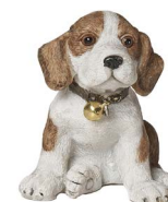
Cod: D 0430 Des: Cagnolino in resina con macchie Note: 5x6x4