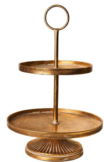
Cod: DM 5069/MR Des: Alzata 2piani brunita Note: 30x30x50