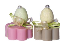
Cod: 7447 Des: Sapone mignon ovetto Note: 4x4x3