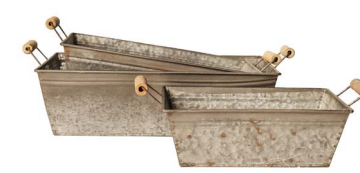
Cod: DM 5040 Des: Ceste rettangolari manici legno S/3 Note: 24x16x8, 30x19x9, 36x23x10