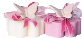
Cod: 7627/RO Des: Sapone decorato farfalla rosa Note: 8x8x6