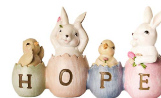
Cod: RS 1018 Des: Coniglietti scritta HOPE Note: 19x4x12