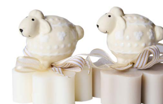
Cod: 7607/BI Des: Sapone decorato pecorella bianca Note: 8x8x10