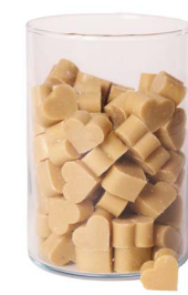
Cod: 4603/Bg Des: Sapone cuore piccolo (pz120) beige Note: 3x2,5x1,7