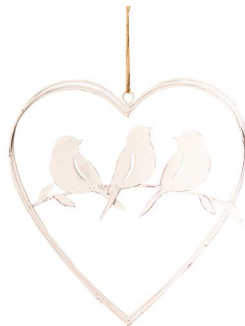
Cod: D 1514 Des: Cuore con uccellini in metallo grande Note: 17,5x17,5