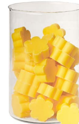
Cod: 4502/Gi Des: Sapone fiore medio (pz50) giallo Note: 4x4x1,7