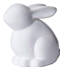
Cod: CK 874 Des: Coniglio medio in ceramica Note: 13x8x12cm