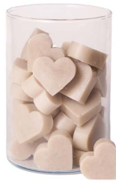
Cod: 4602/To Des: Sapone cuore medio (pz42) tortora Note: 4,5x4,2x1,7