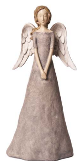
Cod: RS 5190 Des: Angelo in resina mani giunte Note: 14x10x29