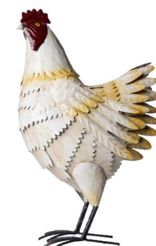
Cod: DM 2034 Des: Gallo bianco piccolo Note: 29x14x46cm