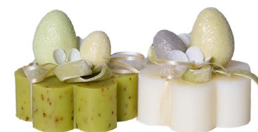
Cod: 7600/Ve Des: Sapone decorato con uova pastello Note: 8x8x10