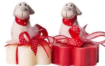
Cod: 7619 Des: Sapone decorato cagnolino Note: 8x8x8,5