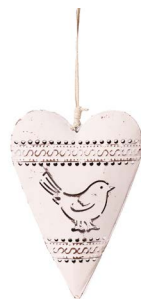
Cod: D 2044 Des: Cuore grande con disegno uccellino Note: 6x11