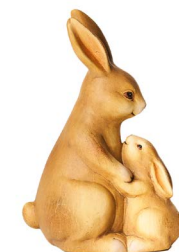
Cod: CK 942 Des: Coppia coniglietti abbracciati Note: 13x9x19