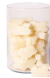
Cod: 4203/Bi Des: Sapone trenino piccolo (pz40) bianco Note: 5x4x1,7