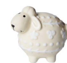
Cod: D 0289/BI Des: Pecorella bianca Note: 5x6x4cm