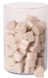
Cod: 4603/To Des: Sapone cuore piccolo (pz120) tortora Note: 3x2,5x1,7