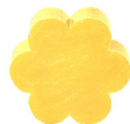
Cod: 4501/Gi Des: Sapone fiore grande giallo Note: 8x8x3