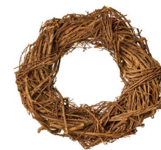
Cod: CN 5013 Des: Corona rami naturali 30cm Note: diam esterno 30cm