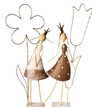
Cod: DM 2023 Des: Fatina con fiore luci Note: 30x10x70