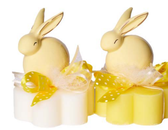
Cod: 7612/GI Des: Sapone decorato coniglio giallo Note: 8x8x10