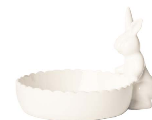
Cod: CK 690 Des: Ciotolina con coniglietto grande Note: 17x13x11