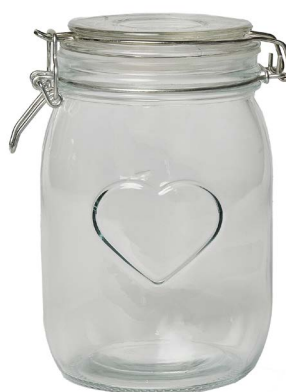
Cod: V 1012 Des: Barattolo bormioli cuore grande Note: 13x13x24