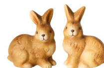
Cod: D 0274 Des: Coniglietti mini seduti Note: 6x4x6