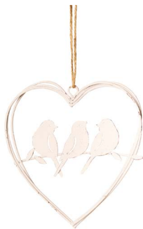
Cod: D 1513 Des: Cuore con uccellini in metallo piccolo Note: 12x12