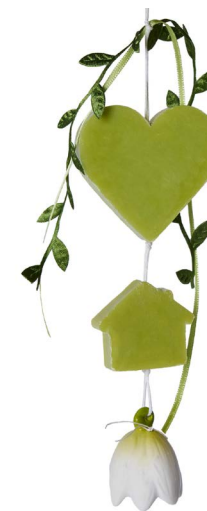
Cod: 7350 Des: Gruppo sapone verde camapnella mini Note: 9x20