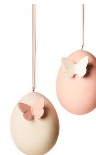
Cod: D 4505 Des: Ovetto da appendere rosa con farfalla Note: 5x5x8,5