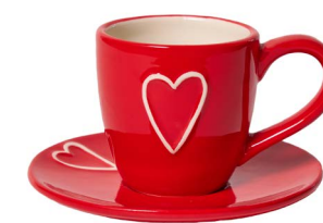
Cod: CK 050/Rs Des: Tazza da caffè con cuore rossa Note: piattino 12x12; tazzina 10x6x7