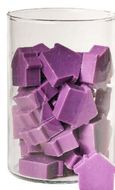
Cod: 4652/Vi Des: Sapone casetta media (42pz) Viola Note: 5x4x1,7