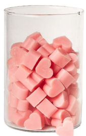
Cod: 4603/Ro Des: Sapone cuore piccolo (pz120) rosa antico Note: 3x2,5x1,7