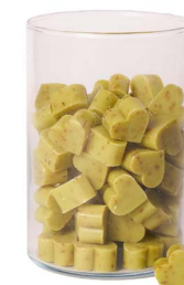
Cod: 4603/Ve Des: Sapone cuore piccolo (pz120) verde Note: 4x4x1,7