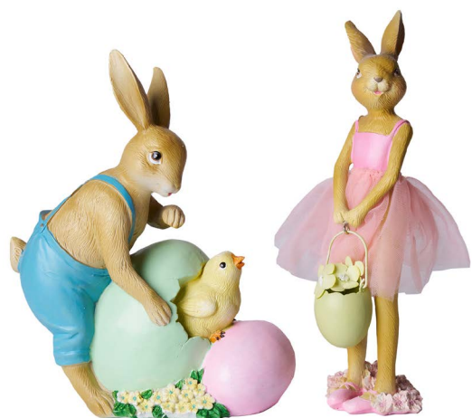
Cod: RS 1021 Des: Coppia coniglietti colorati Note: 12x7x24