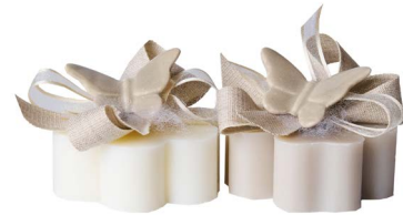
Cod: 7627/Bi Des: Sapone decorato farfalla bianco Note: 8x8x6