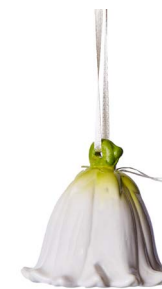
Cod: CC 503 Des: Campanella fiore media bianco/verde Note: 6x6x6cm