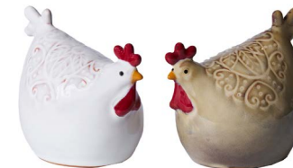
Cod: CK 965 Des: Gallina sarda piccola S/2 Note: 11x9x10,5cm