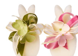
Cod: 7460/VR Des: Sapone coniglietto decorato Note: 4x3x7