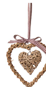
Cod: R 0147/Gr Des: Cuore con cuore appeso piccolo grigio Note: 15x15