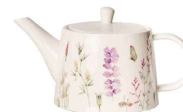
Cod: CK 512 Des: Teiera Primavera Note: 24x12x13