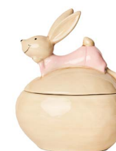
Cod: CK 688 Des: Scatola uovo coniglietta sdraiata Note: 11x8x14