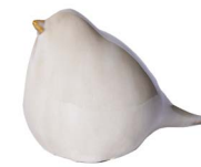
Cod: CK 832 Des: Uccellino verde piccolo Note: 14x8x11