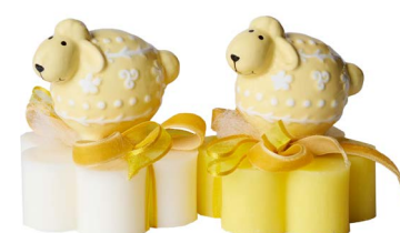
Cod: 7607/GI Des: Sapone decorato pecorella gialla Note: 8x8x10