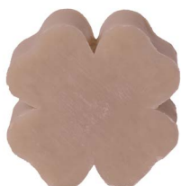
Cod: 4301/Gr Des: Sapone quadrifoglio grande grigio Note: 7,3x7,3x3