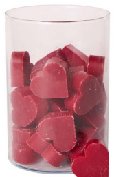
Cod: 4602/RS Des: Sapone cuore medio (pz42) rosso Note: 4,5x4,2x1,7