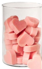
Cod: 4602/Ro Des: Sapone cuore medio (pz42) rosa Note: 4,5x4,2x1,7