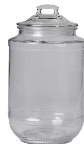
Cod: V 1015 Des: Barattolo liscio grande Note: 17x17x24