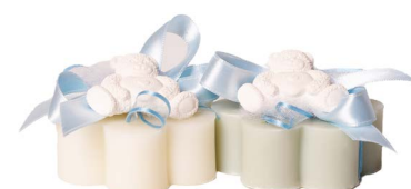
Cod: 7603/Az Des: Sapone decorato baby Note: 8x8x8,5