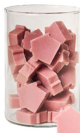
Cod: 4652/Roa Des: Sapone casetta media (42pz) rosa antica Note: 5x4x1,7