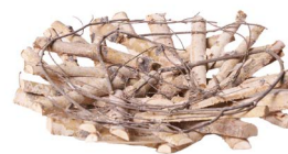
Cod: DL 5009 Des: Piatto legno betulla grande 45cm Note: 41x41x10