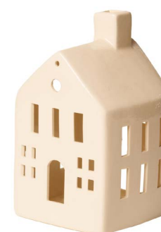
Cod: CK 008 Des: Casetta in ceramica con cerchio Note: 8x8x17