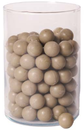
Cod: 4010/Gr Des: Sapone perle (pz125) grigie Note: 2,5x2,5