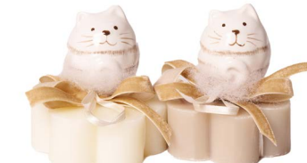
Cod: 7618 Des: Sapone decorato gatto beige Note: 8x8x5