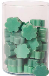
Cod: 4502/VEB Des: Sapone fiore medio (pz50) verde brillante Note: 4x4x1,7