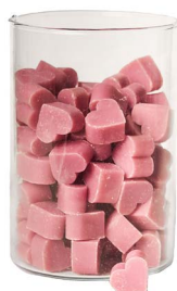
Cod: 4603/Roa Des: Sapone cuore piccolo (pz120) rosa antica Note: 3x2,5x1,7