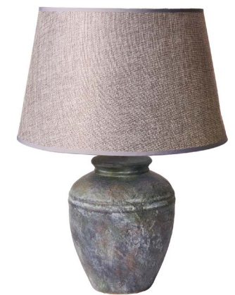
Cod: LC 105 Des: Lampada tonda grigio scuro/paralume grigio Note: 12x50