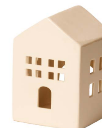
Cod: CK 007 Des: Casetta in ceramica senza camino Note: 7x7x10