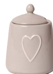
Cod: CK 055/To Des: Zuccheriera con cuore tortora Note: 9x8x12,5