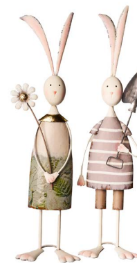
Cod: DM 2027 Des: Coppia conigli grandi Note: 25x15x70