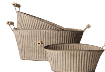
Cod: DM 5046 Des: Ceste ovali rigate con manici S/3 Note: 34.5X25.5X15, 29X23X12, 23X19X9.5