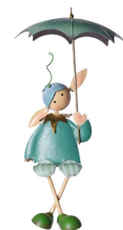
Cod: DM 2025 Des: Bambino seduto con ombrello Note: 20x15x60