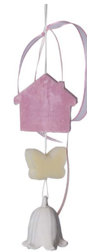
Cod: 7353 Des: Gruppo sapone campanella fiore grande Note: 9x20