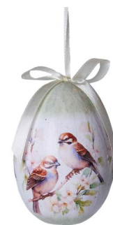
Cod: D 6519 Des: Ovetto coppia uccellini Note: altezza 10cm