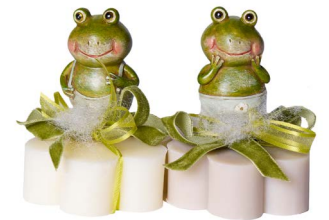
Cod: 7615 Des: Sapone decorato ranocchio Note: 8x8x11