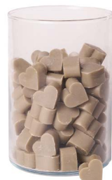
Cod: 4603/Gr Des: Sapone cuore piccolo (pz120) grigio Note: 3x2,5x1,7