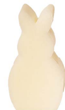
Cod: 4151/Bi Des: Sapone coniglio grande bianco Note: 5x8x3