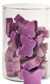
Cod: 4902/Vi Des: Sapone farfalla medio (pz36) viola Note: 4,5x4x1,7