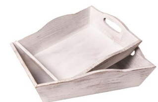
Cod: DL 5000 Des: Set vassoi in legno con manici 2PZ Note: piccolo 29x24x6; grande 35x30x6