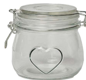
Cod: V 1010 Des: Barattolo bormioli cuore piccolo Note: 12x12x10