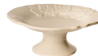
Cod: CK 956 Des: Alzata farfalle 22cm Note: 22x22x7