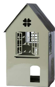
Cod: L 1251 Des: Lanterna piccola laccata verde Note: 14,5x14x29cm