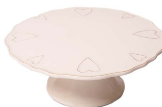
Cod: CK 059 Des: Alzata in ceramica con cuore Note: 27x27x11