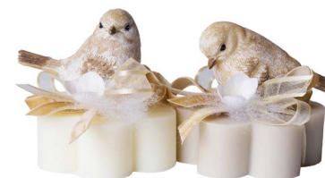
Cod: 7572/Bg Des: Sapone decorato uccellino resina beige Note: 8x8x6