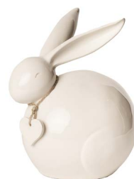
Cod: CK 840 Des: Coniglietto medio con cuore Note: 9x7x10