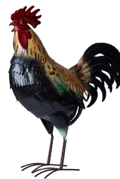
Cod: DM 2033 Des: Gallo giallo/nero grande Note: 44x21x54cm