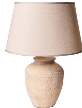
Cod: LC 103 Des: Lampada terracotta/paralume crema Note: 10x53