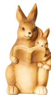
Cod: CK 943 Des: Coppia coniglietti con libro Note: 10x10x21