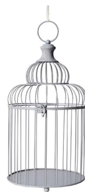
Cod: L 1253 Des: Gabbia uccellini grigia Note: 23x23x43cm