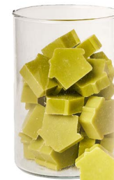
Cod: 4652/Vem Des: Sapone casetta media (42pz) mughetto Note: 5x4x1,7