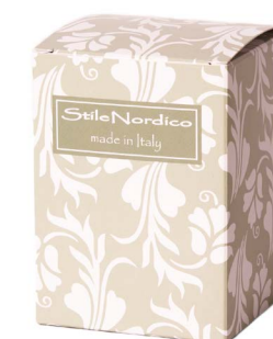
Cod: A 018/Ve Des: Scatola con stampa verde Note: 8X8X11