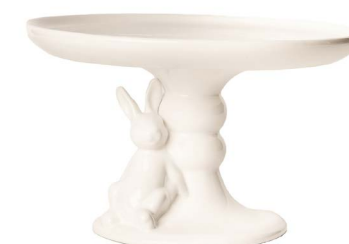
Cod: CK 692 Des: Alzata con coniglietto Note: 25x25x12