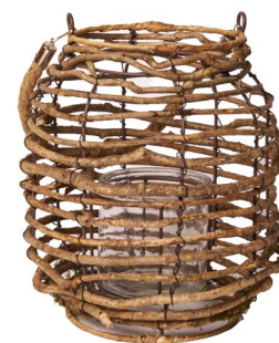
Cod: L 1402 Des: Lanterna legnetti grande Note: 16x16x28