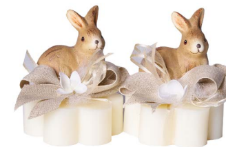
Cod: 7624/Bi Des: Sapone coniglio in terracotta Note: 8x8x5