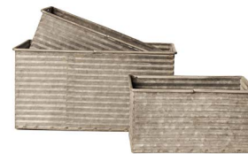
Cod: DM 5039 Des: Ceste rettangolari senza manici S/3 Note: p 23.5X15.5X11.5 m 20X13X10 g 16.5X10.5X8.5