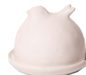
Cod: CK 830 Des: Burriera a forma di uccellino Note: 13x13x10