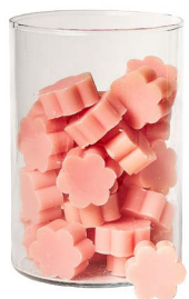
Cod: 4502/Ro Des: Sapone fiore medio (pz50) rosa antico Note: 4x4x1,7