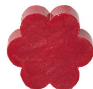
Cod: 4501/RS Des: Sapone fiore grande rosso Note: 8x8x3