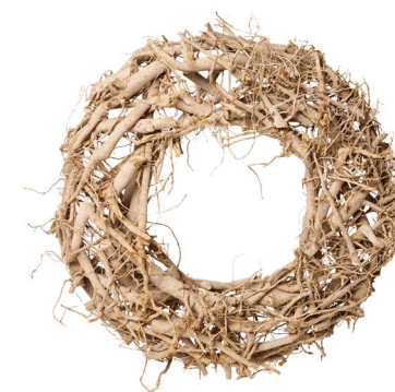
Cod: R 0021/GR Des: Corona bastoncino/vite 45cm grigia Note: 45x45x10