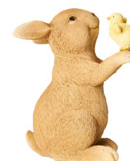
Cod: RS 1025 Des: Coniglietto grande con pulcino Note: 10x8x14