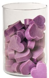
Cod: 4602/Vi Des: Sapone cuore medio (pz42) viola Note: 4,5x4,2x1,7