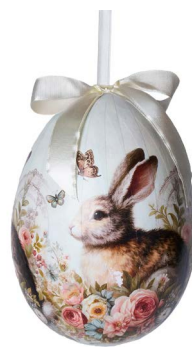
Cod: D 6513 Des: Uovo con conigli sfondo verde Note: altezza 15cm