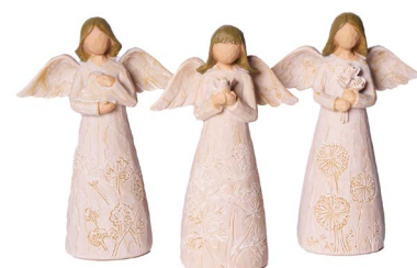
Cod: RS 5215 Des: Angioletti assortiti grandi Note: 10x6x15