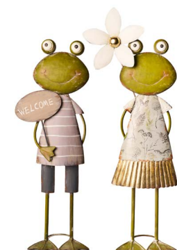
Cod: DM 2021 Des: Coppia rane Note: 20x15x60