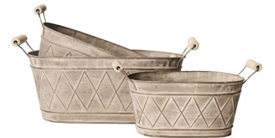
Cod: DM 5044 Des: Ceste ovali manici rombo S/3 Note: 32x18X14, 26.5X16X13, 22X13X11