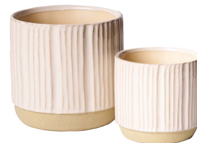
Cod: CK 011 Des: Set vasi con righe verticali Note: 12x11, 15x15