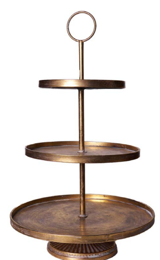
Cod: DM 5070/MR Des: Alzata 3piani grigia Note: 40x40x72