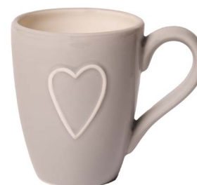
Cod: CK 051/Gr Des: Mug con cuore grigia Note: 12x8x10