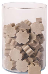
Cod: 4303/Gr Des: Sapone quadrifoglio piccolo (pz65) grigio Note: 3,5x3,5x1,7