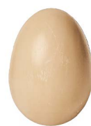
Cod: 4251/To Des: Sapone a uovo tortora Note: 4x4x6