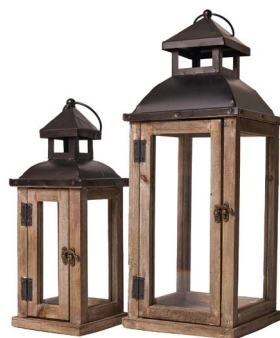
Cod: L 1335 Des: Set lanterne in legno con tetto in metallo Note: piccola 13,5x13,5x36 grande 19x19x50