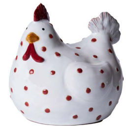
Cod: CK 969 Des: Gallina a pois grande Note: 18x16x20cm