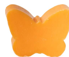
Cod: 4901/Ar Des: Sapone farfalla grande arancione Note: 8x5,5x3