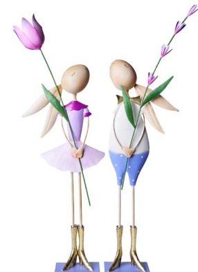
Cod: DM 2028 Des: Coniglietti in metallo con fiori lilla Note: 25x8x43cm