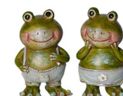
Cod: D 0458 Des: Ranocchio verde Note: 4x4x5,5