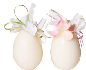
Cod: 7463 Des: Ovetto decorato con ortensia Note: 5x5x7