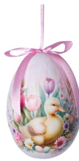
Cod: D 6515 Des: Ovetto con paperella Note: altezza 10cm