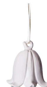
Cod: CC 502 Des: Campanella fiore media bianca Note: 6x6x6cm