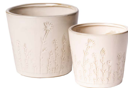
Cod: CK 010 Des: Set vasi con disegno fiore Note: 11x12, 13x14