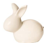
Cod: CK 856/Bi Des: Coniglietto bianco medio Note: 17x10x15