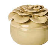
Cod: CK 936/Veq Des: Scatola con fiore verde Note: 11,5x11,5x9