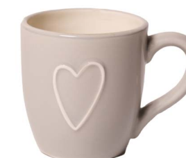
Cod: CK 047/To Des: Mug quadrata con cuore grigia Note: 11x8x9