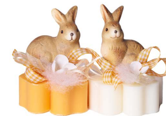
Cod: 7624/Ar Des: Sapone coniglio in terracotta Note: 8x8x6