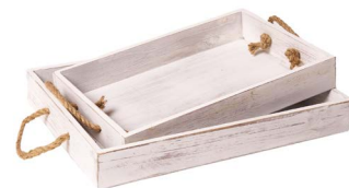
Cod: DL 5002 Des: Set vassoi in legno manici corda 2PZ Note: piccolo 34x24x6; grande 40x29x6