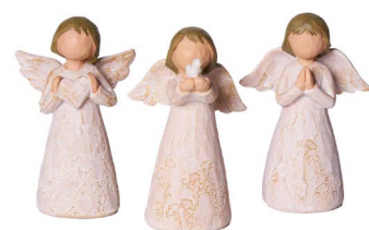
Cod: RS 5214 Des: Angioletti assortiti piccoli Note: 6x5x11