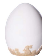
Cod: CK 871 Des: Uovo ceramica con disegno medio Note: 9x9x15