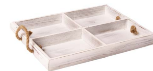
Cod: DL 5003 Des: Vassoio legno con scomparti Note: 37x30x4