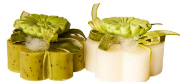
Cod: 7620/Gi Des: Sapone decorato fiore verde Note: 8x8x5