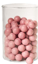
Cod: 4010/Roa Des: Sapone perle (pz125) rosa antico Note: 2,5x2,5