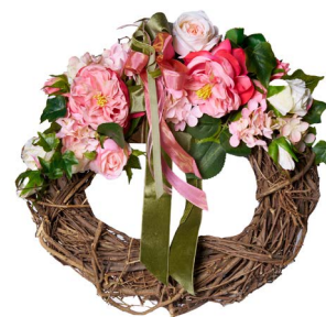
Cod: CN 5013/Ro Des: Corona decorata rose rosa Note: diam esterno 30cm