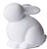
Cod: CK 873 Des: Coniglio piccolo in ceramica Note: 9x5,5x9cm