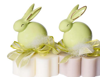
Cod: 7612/VE Des: Sapone decorato coniglio verde Note: 8x8x10