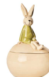
Cod: CK 687 Des: Scatola uovo coniglietto seduto Note: 11x8x17