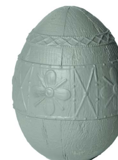
Cod: RS 1013/VE Des: Uovo in resina grande Note: 15x15x20