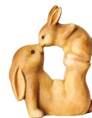
Cod: CK 944 Des: Coppia coniglietti bacino Note: 13x8x17