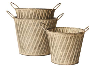
Cod: DM 5049 Des: Ceste rotonde con manici vintage S/3 Note: 17.5X14.5, 16X14, 14.5X12