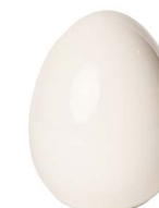
Cod: CK 861 Des: Uovo in ceramica grande Note: 14x14x20