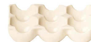
Cod: CK 681 Des: Portauovo rettangolare 6uova Note: 15x9x4