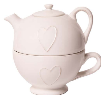
Cod: CK 054 Des: Teiera con tazza cuore Note: 15x12x16