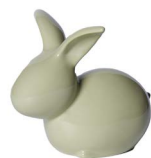
Cod: CK 856/VE Des: Coniglietto medio verde Note: 17x10x15