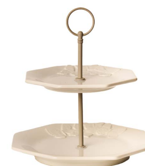
Cod: CK 957 Des: Alzata due piani farfalle Note: 24x24x25