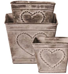
Cod: DM 5041 Des: Ceste con cuore senza manici Note: 10x10x9, 13x13x11, 15x15x13