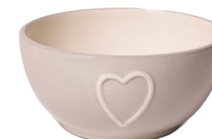
Cod: CK 048/To Des: Ciotola in ceramica cuore tortora Note: 12x12x6,5