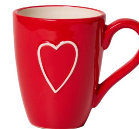
Cod: CK 051/Rs Des: Mug con cuore rossa Note: 12x8x10