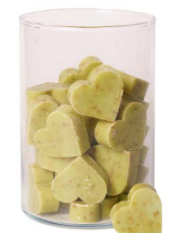
Cod: 4602/Ve Des: Sapone cuore medio (pz42) verde Note: 4,5x4,2x1,7