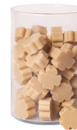
Cod: 4303/Bg Des: Sapone quadrifoglio piccolo (pz65) beige Note: 3,5x3,5x1,7