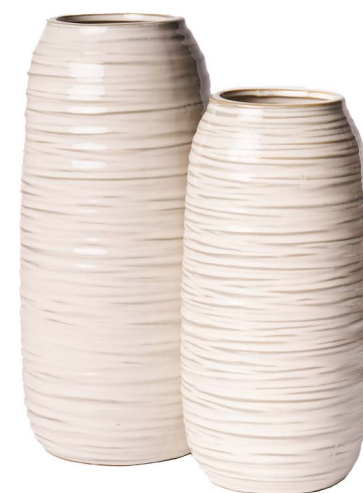
Cod: CK 013 Des: Set vasi cilindrici alti righe orizzontali Note: 11x25, 12x30