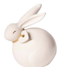
Cod: CK 839 Des: Coniglietto piccolo con cuore Note: 6x4x7