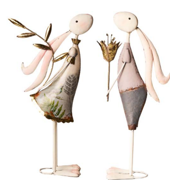
Cod: DM 2026 Des: Coppia coniglietti piccoli Note: 15x10x40