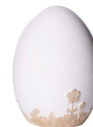
Cod: CK 872 Des: Uovo ceramica con disegno grande Note: 11x11x18