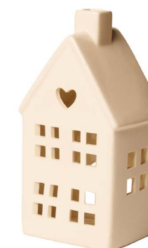
Cod: CK 009 Des: Casetta in ceramica con cuore Note: 8x8x18