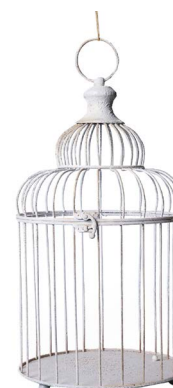
Cod: L 1254 Des: Gabbia uccellini bianca Note: 23x23x43cm