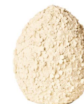
Cod: RS 1011/Bi Des: Uovo grande con fiorellini bianco Note: 12x12x16