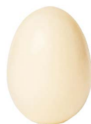
Cod: 4251/Bi Des: Sapone a uovo bianco Note: 4x4x6