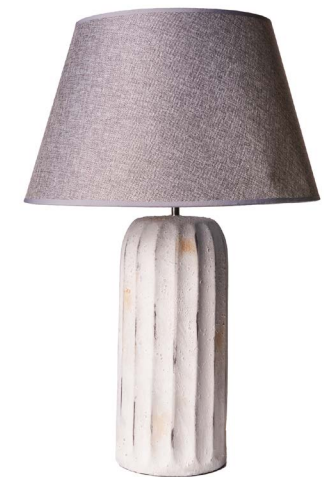
Cod: LC 102 Des: Lampada grande bianca/paralume grigio Note: 17x70