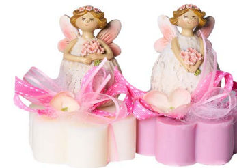
Cod: 7611 Des: Sapone decorato bimba fiori Note: 8x8x10