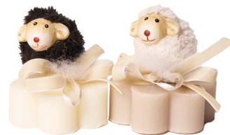
Cod: 7609 Des: Sapone decorato pecorella lana Note: 8x8x8,5