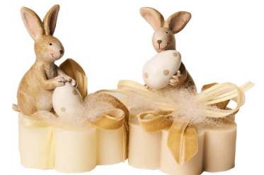
Cod: 7625 Des: Sapone coniglio con uovo pois Note: 8x8x8,5