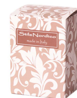
Cod: A 018/BG Des: Scatola con stampa beige Note: 8X8X11