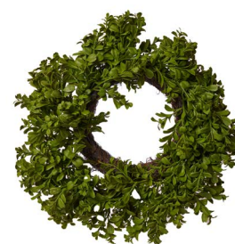
Cod: CN 6043 Des: Corona bossolo media Note: diam interno 23cm