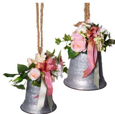
Cod: DM 5053-D Des: Set campanelle decorate rosa Note: piccolo 15x15x18; grande 18x18x20