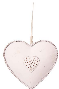
Cod: D 2046 Des: Cuore grande con cuoricino pois Note: 10x10