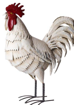
Cod: DM 2035 Des: Gallo bianco grande Note: 42x17x53cm