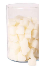
Cod: 4603/Bi Des: Sapone cuore piccolo (pz120) bianco Note: 3x2,5x1,7