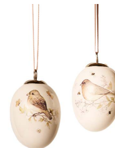
Cod: D 4506 Des: Ovetto in ceramica con uccellino Note: 5x5x8