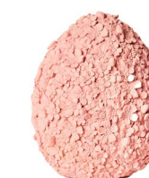
Cod: RS 1011/RO Des: Uovo grande con fiorellini rosa Note: 12x12x16