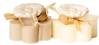
Cod: 7620/Bi Des: Sapone decorato fiore bianco Note: 8x8x5