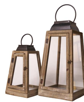
Cod: L 1336 Des: Set lanterne piramide con tetto piatto Note: piccola 21x21x37 grande 27x27x52,5