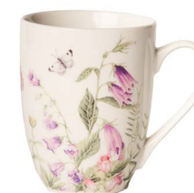
Cod: CK 510 Des: Mug Primavera Note: 11x8x10