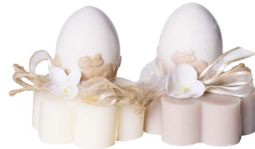
Cod: 7601/Bi Des: Sapone decorato con uova bianco Note: 8x8x10