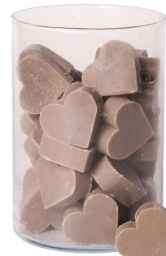
Cod: 4602/Gr Des: Sapone cuore medio (pz42) grigio Note: 4,5x4,2x1,7