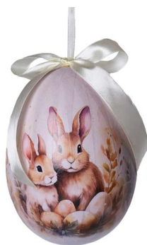
Cod: D 6512 Des: Uovo con coppia conigli Note: altezza 15cm