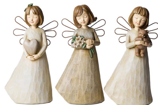
Cod: RS 1032 Des: Angioletti beige assortiti grandi Note: 11x7x21cm