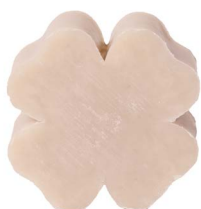
Cod: 4301/To Des: Sapone quadrifoglio grande tortora Note: 7,3x7,3x3