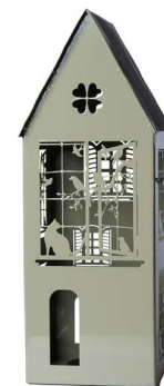
Cod: L 1252 Des: Lanterna grande laccata verde Note: 15x15x42cm