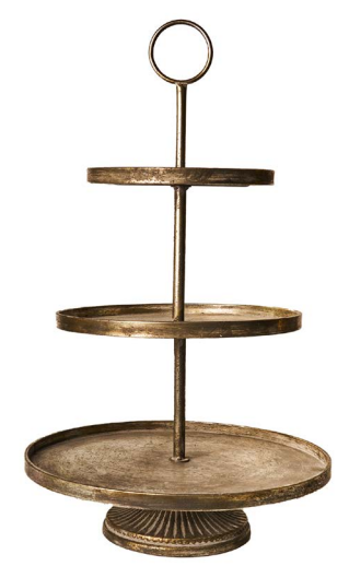
Cod: DM 5070/GR Des: Alzata 3piani grigia Note: 40x40x72