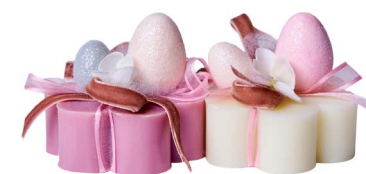
Cod: 7600/Ro Des: Sapone decorato con uova pastello Note: 8x8x10