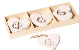
Cod: D 2047 Des: Conf. 9pz. in legno cuore con fiorellino appeso Note: 10x0,5x10