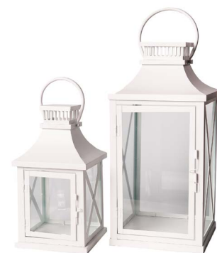
Cod: L 1341 Des: Lanterne metallo con vetro X S/2 Note: 13x35, 18x42, 25x90