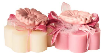
Cod: 7620/Ro Des: Sapone decorato fiore rosa Note: 8x8x5