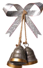
Cod: DM 1108 Des: Gruppo campanelle con fiocco Note: 30x10x50