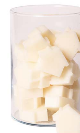
Cod: 4652/Bi Des: Sapone casetta media (42pz) bianco Note: 5x4x1,7