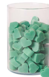
Cod: 4603/Veb Des: Sapone cuore piccolo (pz120) verde brillante Note: 3x2,5x1,7