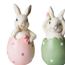
Cod: RS 1029 Des: Coniglietti con uova a pois Note: 6x5,5x12cm