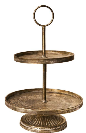
Cod: DM 5069/GR Des: Alzata 2piani grigia Note: 30x30x50