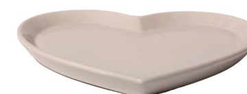
Cod: CK 056/To Des: Piatto a forma di cuore tortora Note: 20x21x2