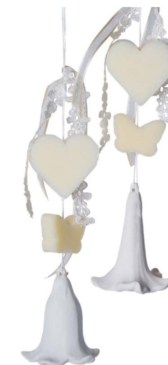
Cod: 7354/BI Des: Gruppo sapone campanella fiore bianca Note: 9x20