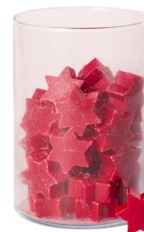
Cod: 4802/Rs Des: Sapone stella media (pz60) rosso Note: 4,4x3,8x1,7