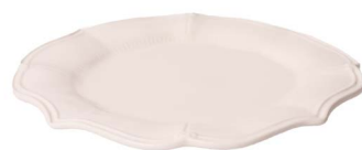
Cod: CK 002 Des: Piatto rotondo in ceramica Note: 33x33x2