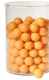
Cod: 4010/Ar Des: Sapone perle (pz125) arancione Note: 2,5x2,5