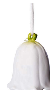
Cod: CC 504 Des: Campanella fiore grande Note: 7x7x8,5cm