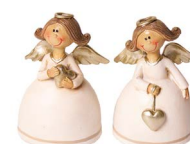
Cod: D 0447 Des: Angioletto con ali argento Note: 5x3x7