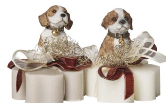
Cod: 7553 Des: Sapone decorato cagnolino macchie Note: 8x8x10