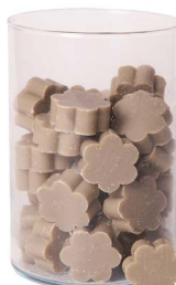
Cod: 4502/Gr Des: Sapone fiore medio (pz50) grigio Note: 4x4x1,7