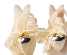
Cod: 7460/BI Des: Sapone coniglietto decorato bianco Note: 4x3x7