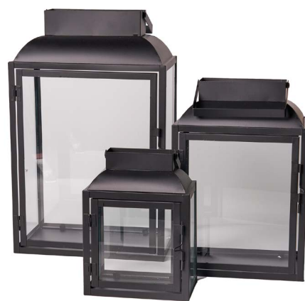
Cod: L 1342 Des: Set lanterne in metallo nero rettangolari S/3 Note: Altezze 25x35x49