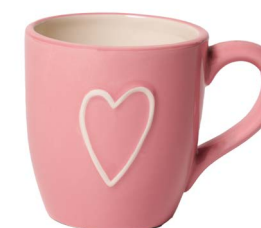
Cod: CK 047/Ro Des: Mug quadrata con cuore rosa Note: 11x8x9