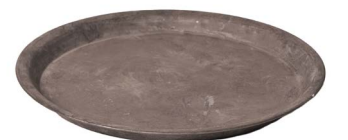
Cod: DM 5018 Des: Vassoio metallo grande Note: 50x50