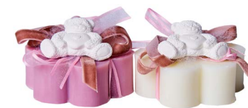
Cod: 7603/Ro Des: Sapone decorato rosa Note: 8x8x8,5