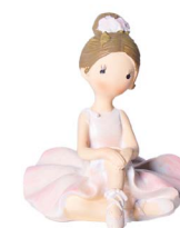
Cod: D 0456 Des: Mini ballerina seduta Note: 4x4x5,5