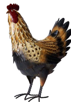
Cod: DM 2032 Des: Gallo giallo/nero piccolo Note: 37x17x44cm