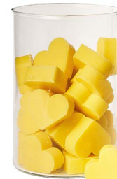
Cod: 4602/Gi Des: Sapone cuore medio (pz42) giallo Note: 4,5x4,2x1,7