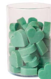
Cod: 4602/VEB Des: Sapone cuore medio (pz42) verde brillante Note: 4,5x4,2x1,7