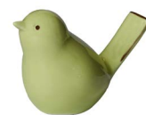
Cod: D 0261/Ve Des: Uccellino verde Note: 5x6x4