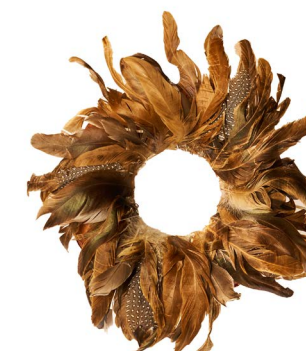
Cod: CN 6010 Des: Corona con piume grande Note: diam esterno 25cm