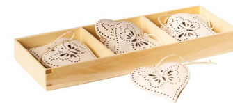
Cod: D 2040 Des: Decorazione metallo cuore farfalle 6pz. Note: 5x5