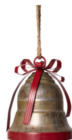
Cod: DM 1102 Des: Campana liscia piccola con fiocco rosso Note: 24x24x27