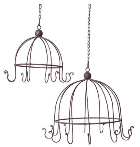
Cod: DM 5036 Des: Espositori a ombrello Note: diam p22; diam g 30