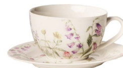
Cod: CK 511 Des: Tazza da tè Primavera Note: piattino 15x15; tazzina 13x10x6