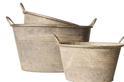
Cod: DM 5022 Des: Cesti maxi ovali manici vintage S/3 Note: 54.5X42X29, 44X35.5X24.5, 35X28X19.5