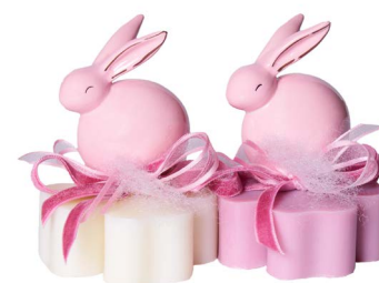
Cod: 7612/RO Des: Sapone decorato coniglio rosa Note: 8x8x10