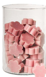
Cod: 4502/Roa Des: Sapone fiore medio (pz50) rosa antico Note: 4x4x1,7