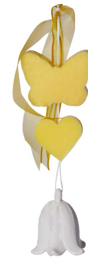
Cod: 7351 Des: Gruppo sapone giallo campanella media bianca Note: 9x20