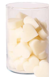
Cod: 4602/Bi Des: Sapone cuore medio (pz42) bianco Note: 4,5x4,2x1,7