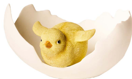
Cod: RS 1023 Des: Svuotasche con pulcino Note: 8x7x1,7