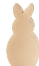
Cod: 4151/Bg Des: Sapone coniglio grande beige Note: 5x8x3