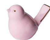
Cod: D 0261/Ro Des: Uccellino rosa Note: 5x6x4