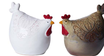
Cod: CK 966 Des: Gallina sarda grande S/2 Note: 16x11x15cm