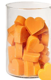
Cod: 4602/Ar Des: Sapone cuore medio (pz42) arancione Note: 4,5x4,2x1,7