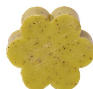
Cod: 4501/Ve Des: Sapone fiore grande verde Note: 8x8x3