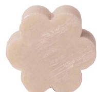
Cod: 4501/To Des: Sapone fiore grande tortora Note: 8x8x3