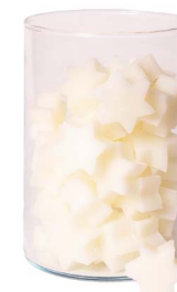
Cod: 4802/Bi Des: Sapone stella media (pz60) bianca Note: 4,4x3,8x1,7