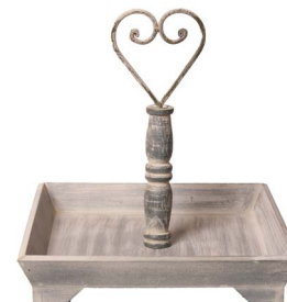
Cod: DL 5005 Des: Espositore in legno naturale 1 piani Note: 30x30x33