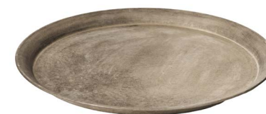
Cod: DM 5016 Des: Vassoio metallo piccolo Note: 39x39