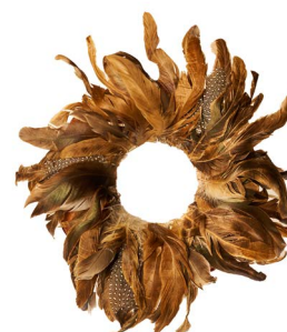
Cod: CN 6009 Des: Corona con piume piccola Note: diam esterno 20cm