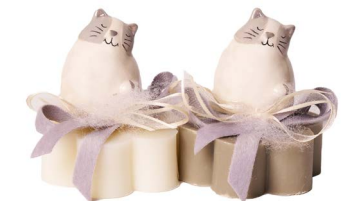
Cod: 7617 Des: Sapone decorato gatto grigio Note: 8x8x8,5