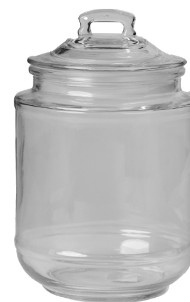
Cod: V 1014 Des: Barattolo liscio medio Note: 13x13x21