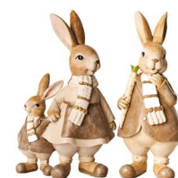
Cod: RS 1020 Des: Coppia coniglietti con sciarpa Note: 14x7x23