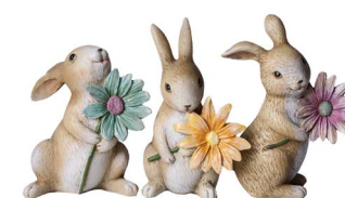
Cod: RS 1030 Des: Coniglietti in resina con margherita Note: 11x7x14