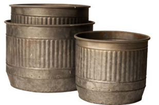
Cod: DM 5048 Des: Ceste rotonde rigate con manici S/3 Note: 22X22X15.5, 20X20X14, 17X17X13.5