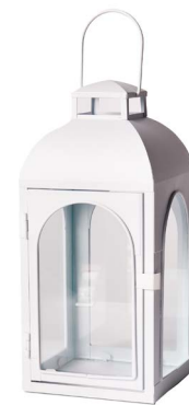
Cod: L 1250 Des: Lanterna in metallo bianco Note: Altezze 14x14x30