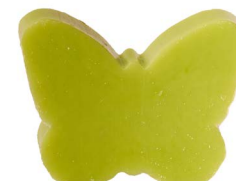
Cod: 4904/Vem Des: Sapone farfalla sottile mughetto Note: 8x5,5x1,7