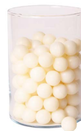
Cod: 4010/Bi Des: Sapone perle (pz125) bianche Note: 2,5x2,5