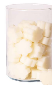
Cod: 4502/Bi Des: Sapone fiore medio (pz50) bianco Note: 4x4x1,7