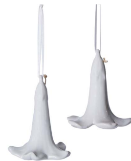
Cod: CC 505/Bi Des: Campana giglio bianca Note: 9x9x10cm