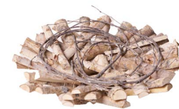
Cod: DL 5008 Des: Piatto legno betulla piccolo 35cm Note: 35x35x8