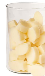
Cod: 4102/Bi Des: Sapone pesce medio (pz50) bianco Note: 4x3x1,7