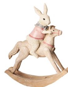
Cod: RS 1017 Des: Coniglietto su cavallo a dondolo Note: 16x6x20