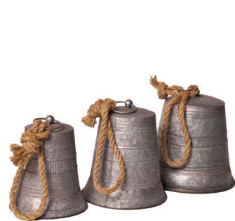
Cod: DM 5054 Des: Set campanelle s/3 Note: diam p 16; diam m 18cm; grande 20x20x22