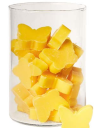
Cod: 4902/Gi Des: Sapone farfalla medio (pz36) giallo Note: 4,5x4x1,7