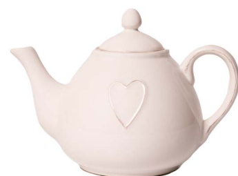
Cod: CK 058 Des: Teiera in ceramica con cuore Note: 20x13x15