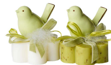
Cod: 7608/VE Des: Sapone decorato uccellino verde Note: 8x8x10