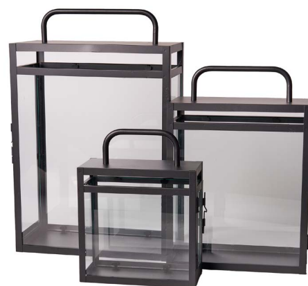
Cod: L 1343 Des: Lanterne metallo nero rettangolari tetto piatto S/3 Note: Altezze 22x30x45