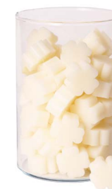
Cod: 4303/Bi Des: Sapone quadrifoglio piccolo (pz65) bianco Note: 3,5x3,5x1,7