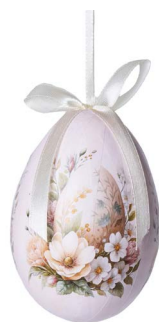
Cod: D 6516 Des: Ovetto colori neutri Note: altezza 10cm