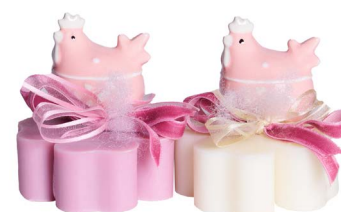
Cod: 7613/RO Des: Sapone decorato gallina rosa Note: 8x8x10