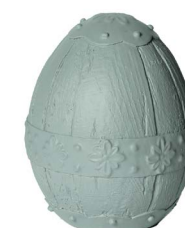
Cod: RS 1012/VE Des: Uovo in resina piccolo Note: 11x11x15