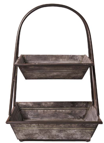
Cod: DM 2040 Des: Alzata due piani Note: 39x39x55