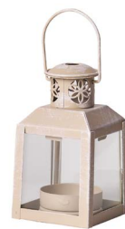
Cod: L 1201 Des: Lanterna mini in metallo beige Note: 4,5x4,5x8