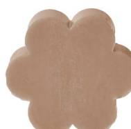
Cod: 4501/Gr Des: Sapone fiore grande grigio Note: 8x8x3