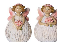
Cod: D 0457 Des: Mini fatina rosa Note: 4x4x5,5