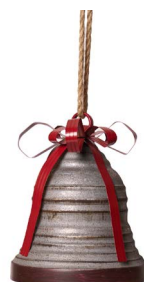
Cod: DM 1105 Des: Campana rigata grande con fiocco rosso Note: 24x24x30