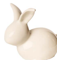
Cod: CK 857/Bi Des: Coniglietto bianco grande Note: 21x12x20