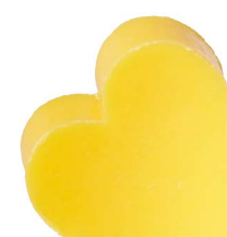
Cod: 4601/Gi Des: Sapone cuore grande verde giallo Note: 6,8x6,5x3