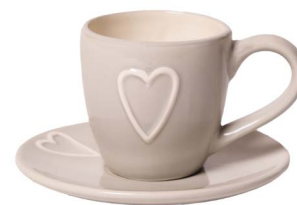
Cod: CK 050/To Des: Tazza da caffè con cuore tortora Note: piattino 12x12; tazzina 10x6x7