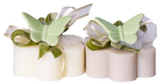
Cod: 7627/VE Des: Sapone decorato farfalla verde Note: 8x8x6