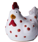
Cod: CK 967 Des: Gallina a pois piccola Note: 9x8x10cm