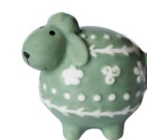
Cod: D 0289/VES Des: Pecorella verde salvia Note: 5x6x4cm