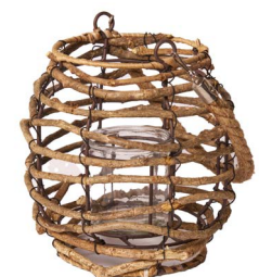
Cod: L 1401 Des: Lanterna legnetti piccola Note: 15x15x21