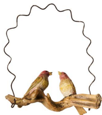
Cod: D 4501/Ro Des: Altalena con uccellini rosa Note: 22x9x28