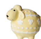
Cod: D 0289/GI Des: Pecorella gialla Note: 5x6x4cm