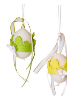
Cod: 7464 Des: Ovetto decorato con feltro Note: 5x5x7