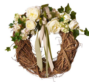
Cod: CN 5013/Bi Des: Corona decorata rose bianche Note: diam esterno 30cm