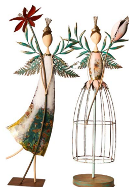
Cod: DM 2022 Des: Angelo Primavera con luci Note: 20x15x74