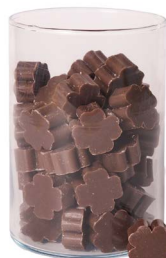
Cod: 4303/Mr Des: Sapone quadrifoglio piccolo (pz65) marrone Note: 3,5x3,5x1,7