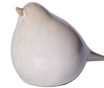
Cod: CK 833 Des: Uccellino verde grande Note: 17x10x13