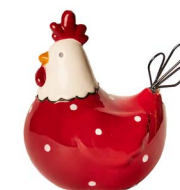
Cod: CK 938 Des: Gallina rossa media con pois Note: 12x10x13