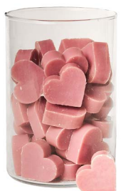
Cod: 4602/Roa Des: Sapone cuore medio (pz42) rosa antico Note: 4,5x4,2x1,7